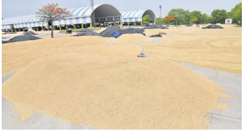
సిద్దిపేట యార్డులో రైతులు ఎండబెట్టిన ధాన్యం కుప్పలు

పాలు మరో నాలుగు సెంటర్లలో నాలుగు రోజుల క్రితం వరకు 115మంది రైతులకు చెందిన 5,700 క్వింటాళ్ళ వడ్డీ మాత్రమే కొన్నారు. అన్ని సెంటర్లకు ప్యాకీ క్లీన్ చేసి, మ్యాన్యురల్ మిషన్లు, కాంటలు వంటి సదుపాయాలు మాత్రం నత్తేనయం సాగుతున్నాయి. డబ్బులు కూడా బ్యాంకులో తగ్గరగా జమకావడం లేదని రైతులు తెలిపారు. క్వింటాలుకు రూ. 500 బోనస్ ఇవ్వమని చెప్పిన కాంగ్రెస్ సర్కారు ఇప్పటికీ కనిపించలేదు. వాతావరణంలో మార్పులు వస్తుండడం, ఆకాశం మేఘావృత్తం అవుతుండడంతో వర్షం వచ్చే అవకాశం ఉందని రైతులు ఆందోళన చెందుతున్నారు. త్వరగా కొనుగోళ్లు చేపట్టాలని కోరుతున్నారు.