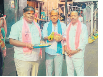
తులాపూర్ భవనీమాతకు మొక్కలు చెల్లిస్తూ బీఆర్ఎస్ నాయకులు