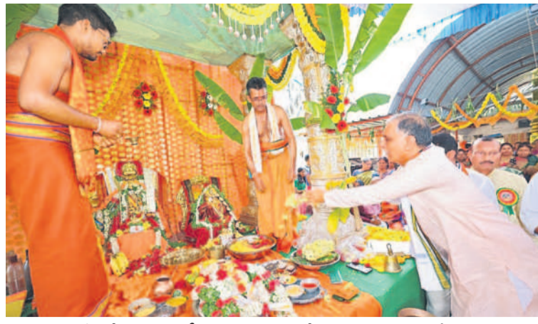
సిద్దిపేటలో నిర్వహించిన సీతారాముల కల్యాణంలో పాల్గొన్న మాజీ మంత్రి హరీశ్ కౌటా