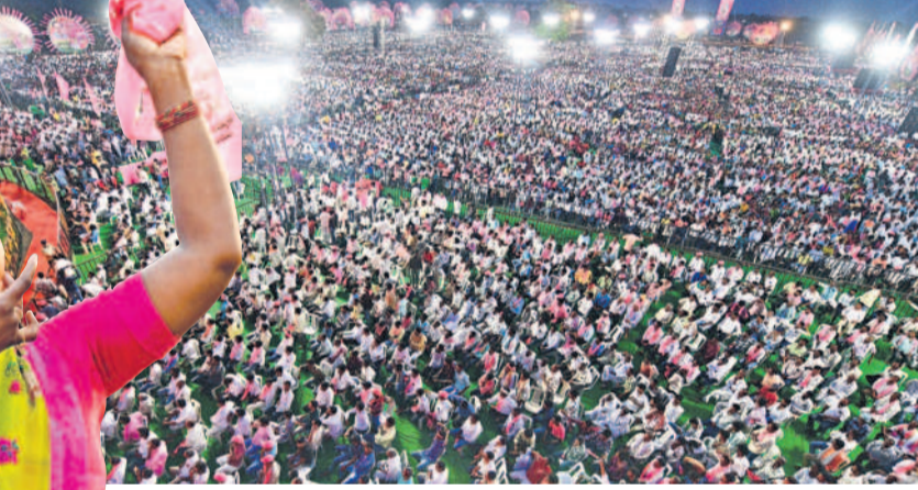
మంగళవారం సంగారెడ్డి జిల్లాలో జరిగిన ప్రజా అశీర్వాద సభకు హాజరైన లానేషన్ జనపాని