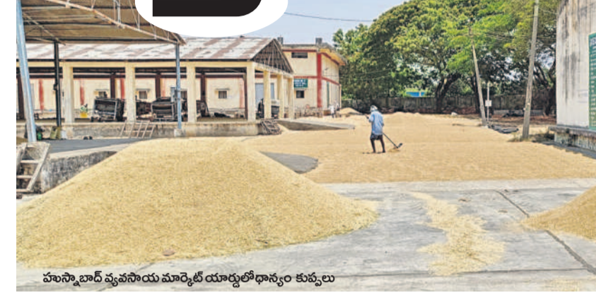
హుస్సేన్ బాద్ రెవెన్యూ డివిజన్ యార్డులో ధాన్యం కుప్పలు

సిద్దిపేట/దుబ్బాక/హుస్సేన్ బాద్/చేర్యాల, ఏప్రిల్ 17: సిద్దిపేట జిల్లాలో యాసంగి ధాన్యం కొనుగోళ్లు నత్తేనయం సాగుతున్నాయి. దీంతో రైతులు ఇబ్బందులు ఎదుర్కొంటున్నారు. జిల్లాలో మొత్తం 418 కొనుగోలు కేంద్రాలను ప్రారంభించినట్లు అధికారులు తెలిపారు. ఈ కేంద్రాలను ప్రారంభించినా ధాన్యం కొనుగోళ్లు మాత్రం ఆగిపోయిన స్థాయిలో చేపట్టడం లేదు. ఏప్రిల్ 1 నుంచి ధాన్యం కొనుగోలు కేంద్రాల ప్రారంభమైనప్పటికీ ఇప్పటి వరకు కేవలం పండల్లో రైతుల వద్ద మాత్రమే కొనుగోలు చేశారు. ఐకేపీ ద్వారా 210 కేంద్రాలు, ప్రాథమిక సహకార సంఘాల ద్వారా 202 కేంద్రాలు, మెట్టా ద్వారా 6 కొనుగోలు కేంద్రాలను ప్రారంభించారు. సిద్దిపేట యార్డులో ధాన్యం కొనుగోలు కేంద్రాలను ప్రారంభించినప్పటికీ ఇప్పటి వరకు కేవలం పండల్లో రైతుల వద్ద మాత్రమే కొనుగోలు చేశారు. ఐకేపీ ద్వారా 210 కేంద్రాలు, ప్రాథమిక సహకార సంఘాల ద్వారా 202 కేంద్రాలు, మెట్టా ద్వారా 6 కొనుగోలు కేంద్రాలను ప్రారంభించారు. సిద్దిపేట యార్డులో ధాన్యం కొనుగోలు కేంద్రాలను ప్రారంభించినప్పటికీ ఇప్పటి వరకు కేవలం పండల్లో రైతుల వద్ద మాత్రమే కొనుగోలు చేశారు. ఐకేపీ ద్వారా 210 కేంద్రాలు, ప్రాథమిక సహకార సంఘాల ద్వారా 202 కేంద్రాలు, మెట్టా ద్వారా 6 కొనుగోలు కేంద్రాలను ప్రారంభించారు. సిద్దిపేట యార్డులో ధాన్యం కొనుగోలు కేంద్రాలను ప్రారంభించినప్పటికీ ఇప్పటి వరకు కేవలం పండల్లో రైతుల వద్ద మాత్రమే కొనుగోలు చేశారు. ఐకేపీ ద్వారా 210 కేంద్రాలు, ప్రాథమిక సహకార సంఘాల ద్వారా 202 కేంద్రాలు, మెట్టా ద్వారా 6 కొనుగోలు కేంద్రాలను ప్రారంభించారు.