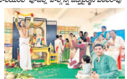
నర్సింగ్పల్లి ఇందూరు తిరుమల ఆలయంలో దిల్రాజు.