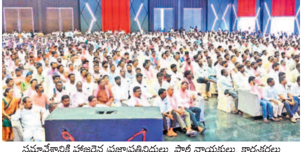
సమావేశానికి హాజరైన ప్రజాప్రతినిధులు, పార్టీ నాయకులు, కార్యకర్తలు