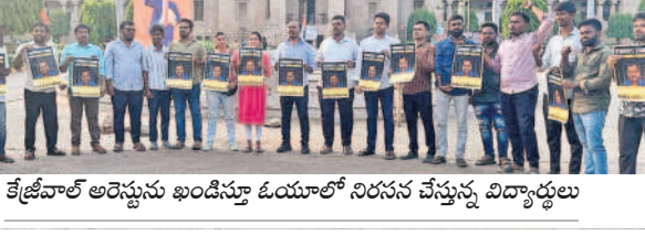
కేజ్రీవాల అరెస్టును ఖండిస్తూ ఓయూలో నిరసన చేస్తున్న విద్యార్థులు

నార్సాపేట, ఏప్రిల్ 16: కేజ్రీవాల అరెస్టును ఖండిస్తూ ఉస్మానియా యూనివర్సిటీలో వివిధ విద్యార్థి సంఘాల నాయకులు నిరసన వ్యక్తం చేశారు. ఈ సందర్భంగా విద్యార్థి సంఘం మాట్లాడుతూ.. బీజేపీకి వ్యతిరేకంగా ఎవరు మాట్లాడితే వారిని ఈడీ పేరుతో అక్రమ అరెస్టులు చేస్తున్నారని మండిపడ్డారు. ఇది ఓయూ కాటామిలో ముఖ్య నేత అయిన కేజ్రీవాల అరెస్టు చేసి, కుటుంబీకులను దెబ్బతీసే ప్రయత్నం చేస్తున్నారని ఆరోపించారు. ఇటువంటి వాటికి భయపడే ప్రవృత్తి లేదని స్పష్టం చేశారు. విద్యార్థులుగా ప్రధాన నరేంద్రమాడికి ఒక నూటి ప్రభుత్వ వేస్తున్నామని తెలిపారు.