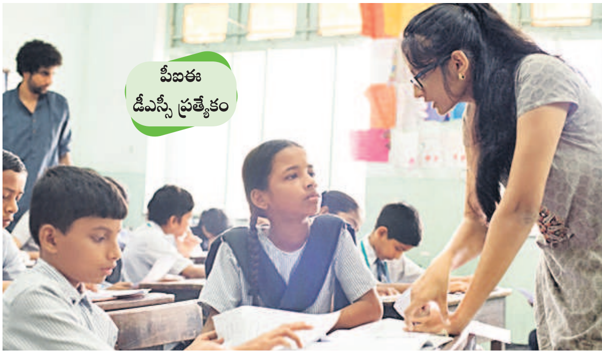
పీఠికా డీఎస్సీ ప్రత్యేకం