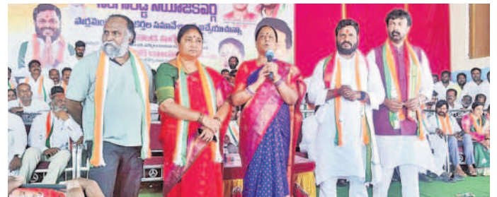
సంగారెడ్డి జిల్లా కొండాపూర్ మండలం మల్కాపూర్ లో మాట్లాడుతున్న మంత్రి కొండా సురేఖ