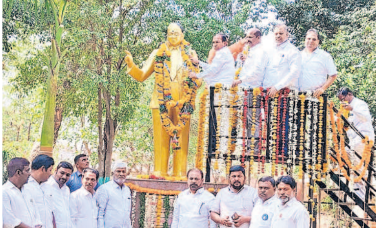
జహీరాబాద్ పట్టణంలో నివాళులు అర్పిస్తున్న ఎమ్మెల్యే కొనింటి మాజీకేరావు