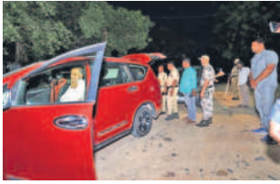
మాజీ మంత్రి, ఎమ్మెల్యే హరిశ్చంద్రావు వాహనాన్ని తనిఖీ చేస్తున్న పోలీసులు

నారాయణఖేడ్, ఏప్రిల్ 14: లోక్ సభ ఎన్నికల నేపథ్యంలో అధివారం నారాయణఖేడ్ పట్టణ సమీపంలోని వెంకటాచార్య చౌరస్తా వద్ద మాజీ మంత్రి హరిశ్చంద్రావు వాహనాన్ని పోలీసులు తనిఖీ చేశారు. నారాయణఖేడ్ లో బీఆర్ఎస్ కార్యకర్తల సన్నాహక సమావేశంలో పాల్గొని నర్సాపూర్ వెళ్తున్న క్రమంలో స్థానిక ఎస్ఐ విద్యావరత్ రెడ్డి నేతృత్వంలోని ప్రత్యేక బలగాలు వాహనం తనిఖీలు చేస్తుండగా మాజీ మంత్రి తన వాహనాన్ని నిలిపి పోలీసులకు సహకరించారు. పోలీసులు తనిఖీలు పూర్తైన అనంతరం హరిశ్చంద్రావు బయలుదేరి వెళ్లారు.