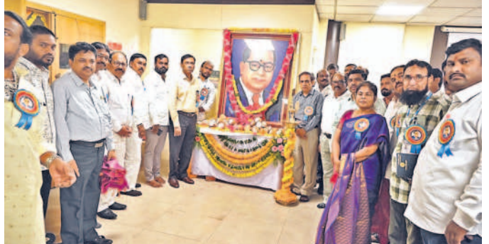
జలమండలి ప్రధాన కార్యాలయంలో డాక్టర్ బీఆర్ అంబేద్కర్ చిత్తరేణిని పునరుద్ధరించారు. సామాజిక న్యాయం కోసం జీవితాంతం పోరాడిన మహానీయుడు అంబేద్కర్ అని కొనియాడారు.