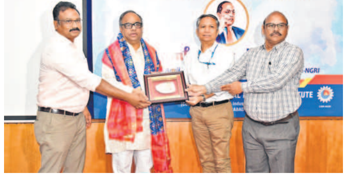
సీఎస్ఎల్ఐ ల్యాబ్లో అంబేద్కర్ చిత్తరేణిని పునరుద్ధరించారు. సామాజిక న్యాయం కోసం జీవితాంతం పోరాడిన మహానీయుడు అంబేద్కర్ అని కొనియాడారు.