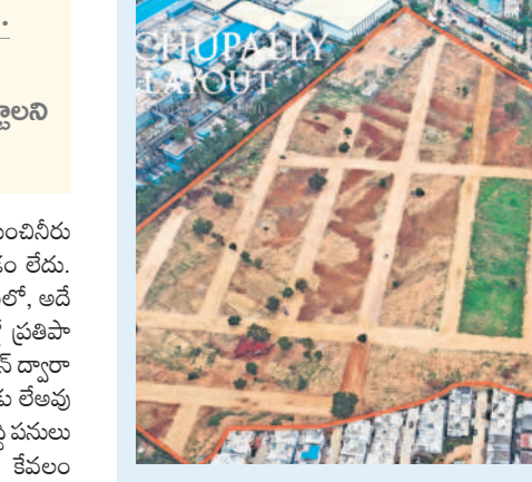
నాలుగు నెలలు గడుస్తున్నా..

సిటీబ్యూరో, ఏప్రిల్ 14 (నవస్త తెలంగాణ) : ప్రభుత్వం ఏర్పాటు చేసిన లేఅవుట్ల అంటే ప్రజలకు ఎంతో సమ్మతం. మార్కెట్ ప్లాన్ నిబంధనలకు అనుగుణంగా నిర్మిత సమయంలో సమగ్ర మౌలిక వసతులతో లేఅవుట్లను అభివృద్ధి చేసి అప్రగిస్ట్రేషన్లు ముగిసి పేరు హైదరాబాద్ మెట్రోపాలిటన్ డెవలప్ మెంట్ అథారిటీ(హెచ్ఎంసీపి)కి ఉంది. ఇప్పటికే చగ రంలో పలు కోట్ల అభివృద్ధి చేసిన లేఅవుట్ల అందుకు నిదర్శనం.. అలాంటి హెచ్ఎంసీపి బహుదూరపల్లి, బాచుపల్లిలో ప్రతిపాదించిన లేఅవుట్లు అభివృద్ధికి నోచుకోవడం లేదు. ప్రభుత్వం మారడంతో అందరిలో పాట్లు ఉన్నవారు అయోమయానికి గురవుతున్నారు. ప్రభుత్వ రంగ సంస్థగా హెచ్ఎంసీపి వెంచర్ లో పాట్లు అని లక్షలు చెల్లించి కొనుగోలు చేశాం.. నెలలు గడుస్తున్నా లేఅవుట్లలో చేపట్టా