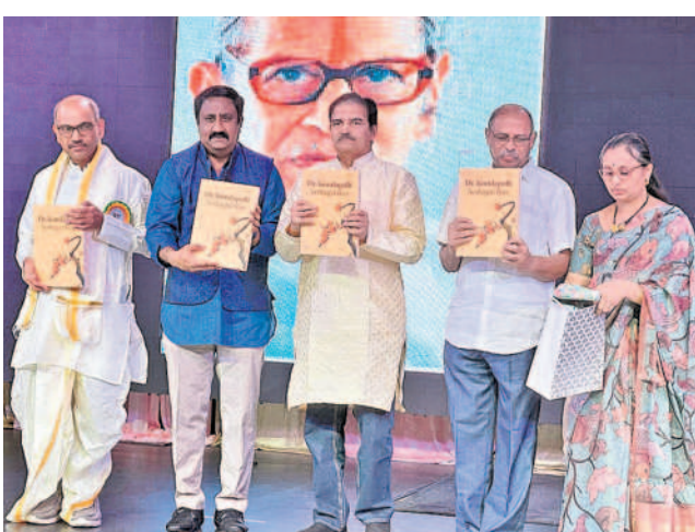
కెనడాలోని టోరంటో నగరంలో కొండపల్లి శేషగిరి రావు శత జయంతోత్సవాల సందర్భంగా పుస్తకావిష్కరణలో ప్రముఖులు