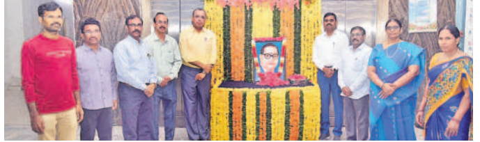
జీహెచ్ఎంసీ ప్రధాన కార్యాలయంలో డాక్టర్ బీఆర్ అంబేద్కర్ చిత్తరేణిని పునరుద్ధరించారు. సామాజిక న్యాయం కోసం జీవితాంతం పోరాడిన మహానీయుడు అంబేద్కర్ అని కొనియాడారు.