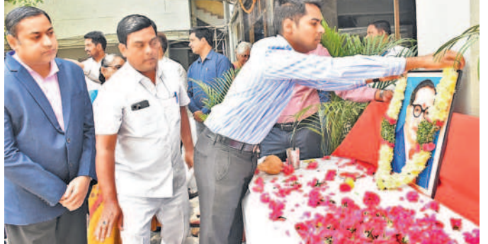
హైదరాబాద్ కలెక్టరేట్లో అంబేద్కర్ చిత్తరేణిని పునరుద్ధరించారు. సామాజిక న్యాయం కోసం జీవితాంతం పోరాడిన మహానీయుడు అంబేద్కర్ అని కొనియాడారు.