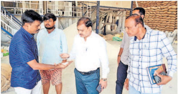
రైస్ మిల్లులోని సీఎంఆర్ బియ్యన్ను పరిశీలిస్తున్న అదనపు కలెక్టర్ లింగ్వానాయక్