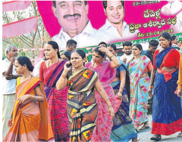
చేవెళ్లలో జరిగిన ప్రజా ఆరోగ్య సభకు భారీగా తరలివచ్చిన మహిళలు, బీఆర్ఎస్ శ్రేణులు