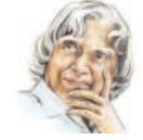
- ఏసీజే అబ్దుల్ కలాం.

అభ్యాసం సృజనాత్మకతను ఇస్తుంది. సృజనాత్మకత ఆలోచనకు దారితీస్తుంది. ఆలోచన జ్ఞానాన్ని అందిస్తుంది. జ్ఞానం.. మిమ్మల్ని గొప్పగా చేస్తుంది.