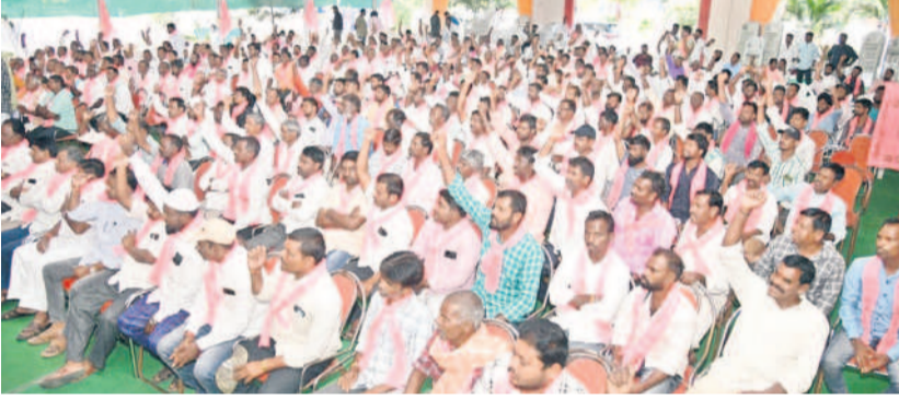
దేవరకల్లో జరిగిన సమావేశానికి హాజరైన ప్రజాప్రతినిధులు, బీఆర్ఎస్ నేతలు, కార్యకర్తలు