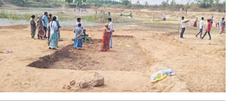
అటు హాజరవుతున్నారు. ఈ వేసవి సీజన్లో ఎక్కువగా వ్యవసాయ సంబంధ పనులు చేపట్టాలన్నారు.

గడిచిన రోజుల్లో పనిదినాల సంఖ్య ఇలా.. 2020-21లో 59.97 లక్షల పని దినాలు 2021-22లో 51.55 లక్షల పని దినాలు 2022-23లో 45.38 లక్షల పని దినాలు 2023-24లో 43.16 లక్షల పని దినాలు 2024-25లో 32.78 లక్షల పని దినాలు అటు హాజరవుతున్నారు. ఈ వేసవి సీజన్లో ఎక్కువగా వ్యవసాయ సంబంధ పనులు చేపట్టాలన్నారు. ఈ వేసవి సీజన్లో ఎక్కువగా పాత నీటి వెళ్లడం ద్వారా, మట్టి పనులు, చెరువు పూడిక