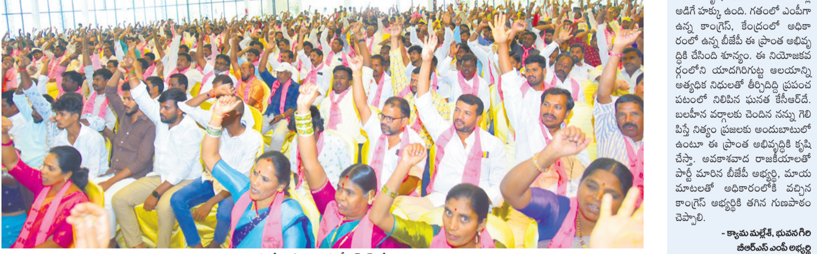
సమావేశానికి హాజరైన బీఆర్ఎస్ శ్రేణులు

పూలే, అంబేద్కర్ ఆశయాలకు అనుగుణంగా అభ్యర్థుల ఎంపిక బీఆర్ఎస్ పార్టీ వర్కింగ్ ప్రెసిడెంట్ కేటీఆర్