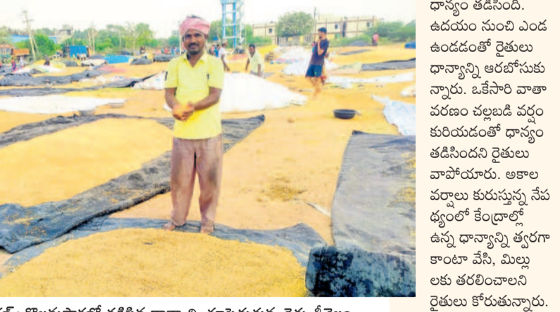
అలేరు రూరల్ : కొలనుపాటిలో తడిసిన ధాన్యాన్ని మామిడితున్న రైతు త్రీతైం

నల్లగొండ, ఏప్రిల్ 12 : నల్లగొండ జిల్లాలో శుభ్రవారం కురిసిన వర్షం అన్నదాతను ఉలిక్కిపెట్టేలా చేసింది. కొనుగోలు కేంద్రాల్లో అమ్ముకానికి పోసిన ధాన్యం కాపాడుకునేందుకు ఇబ్బందులు పడాల్సి వచ్చింది. ఇంకా కొక దశలో ఉన్న పంటను ఎలాంటి నష్టం జరుగకుండానే అందజేసే చెందారు. అయితే, పది రోజులుగా గరిష్ట ఉష్ణోగ్రతలతో నిప్పుల కొలిమిలో మారిన నల్లగొండ జిల్లా జనానికి క్యాన్సర్ ఊపమనం కలిగింది చెప్పుచున్నా. జిల్లాలో పది మండలాల్లో పాక్షిక వర్షం కురువడంతో వెర్షగా నష్టం జరుగకపోయినప్పటికీ అక్కడక్కడ పాక్షికంగా ధాన్యం తడిసింది. ఇక ప్రభుత్వ యంత్రాంగం ఇప్పటి వరకు 83,500 మెట్రిక్ టన్నుల ధాన్యం కొనుగోలు చేసింది. అందులో 738 మెట్రిక్ టన్నులు మినహోయస్తే మిగిలిన ధాన్యం మిల్లల్లో తరలించడం వల్ల కొన్ని వద్ద పెద్దగా తడవలేదని అంటున్నారు. జిల్లాలో మొత్తం 370 కేంద్రాల్లో కొనుగోలు చేస్తుండగా ఇంకా లక్షన్నర మెట్రిక్ టన్నుల ధాన్యం ఆయా కేంద్రాల్లో ఉన్నప్పటికీ అందులో ఈ ధాన్యం తడవకుండా అన్నదాతులు ఎంతో ప్రయాస పడాల్సి వచ్చింది.