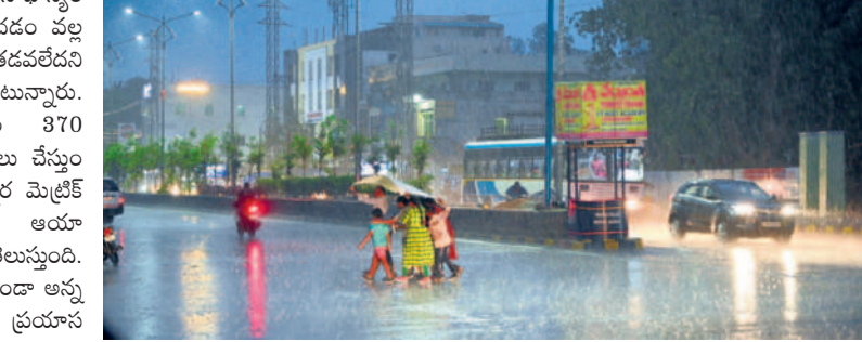
నల్లగొండలో కరువునన్న వర్షం

నల్లగొండ, ఏప్రిల్ 12 : నల్లగొండ జిల్లాలో శుభ్రవారం కురిసిన వర్షం అన్నదాతను ఉలిక్కిపెట్టేలా చేసింది. కొనుగోలు కేంద్రాల్లో అమ్ముకానికి పోసిన ధాన్యం కాపాడుకునేందుకు ఇబ్బందులు పడాల్సి వచ్చింది. ఇంకా కొక దశలో ఉన్న పంటను ఎలాంటి నష్టం జరుగకుండానే అందజేసే చెందారు. అయితే, పది రోజులుగా గరిష్ట ఉష్ణోగ్రతలతో నిప్పుల కొలిమిలో మారిన నల్లగొండ జిల్లా జనానికి క్యాన్సర్ ఊపమనం కలిగింది చెప్పుచున్నా. జిల్లాలో పది మండలాల్లో పాక్షిక వర్షం కురువడంతో వెర్షగా నష్టం జరుగకపోయినప్పటికీ అక్కడక్కడ పాక్షికంగా ధాన్యం తడిసింది. ఇక ప్రభుత్వ యంత్రాంగం ఇప్పటి వరకు 83,500 మెట్రిక్ టన్నుల ధాన్యం కొనుగోలు చేసింది. అందులో 738 మెట్రిక్ టన్నులు మినహోయస్తే మిగిలిన ధాన్యం మిల్లల్లో తరలించడం వల్ల కొన్ని వద్ద పెద్దగా తడవలేదని అంటున్నారు. జిల్లాలో మొత్తం 370 కేంద్రాల్లో కొనుగోలు చేస్తుండగా ఇంకా లక్షన్నర మెట్రిక్ టన్నుల ధాన్యం ఆయా కేంద్రాల్లో ఉన్నప్పటికీ అందులో ఈ ధాన్యం తడవకుండా అన్నదాతులు ఎంతో ప్రయాస పడాల్సి వచ్చింది.