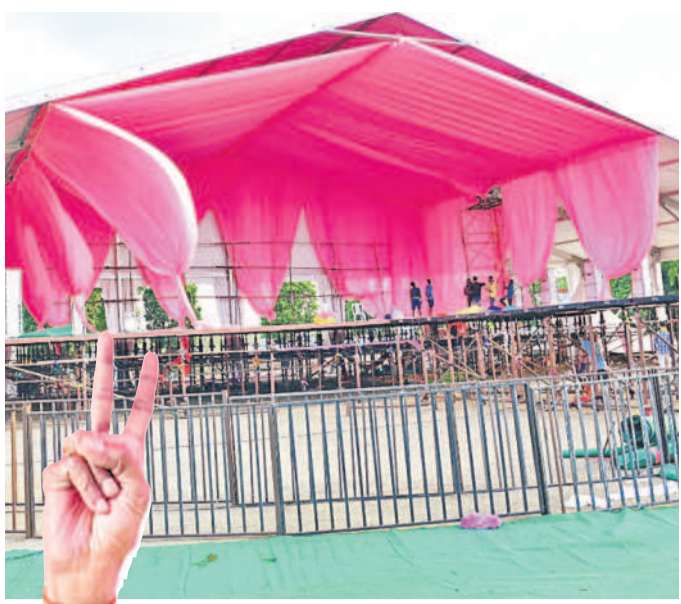
చేవెళ్లలో నిర్వహించిన ప్రజా ఆశీర్వాద సభా వేదిక