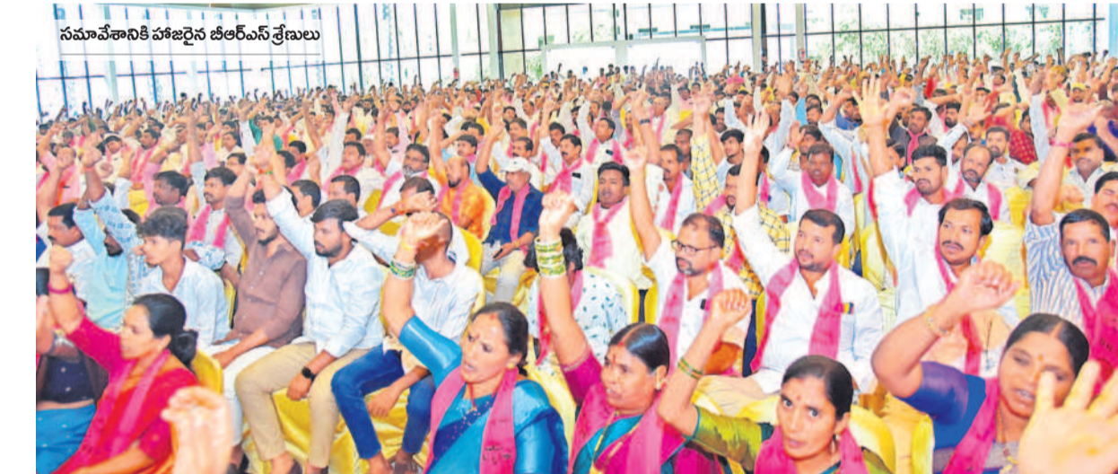
సమావేశానికి హాజరైన బీఆర్ఎస్ శ్రేణులు