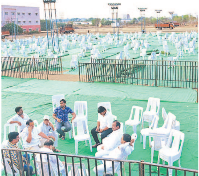
చేవెళ్ల ప్రజా ఆశీర్వాద సభా ప్రాంగణం

గులాబీమయం.. కేసీఆర్ పోస్టల్లో ఎన్నికల బహిరంగ సభకు చేవెళ్ల ముస్తాబైంది. పట్టణంలోని రోడ్లన్నీ గులాబీ జెండాలతో రెవరెండులాడుతున్నాయి. ప్రధాన కూడళ్లు, రహదారుల వెంట గులాబీ ఫైక్లీలు, జెండాలు పెద్ద ఎత్తున ఏర్పాట్లు చేశారు. సభా ప్రాంగణాన్ని సైతం గులాబీమయం చేశారు. ప్రజలు దూరం నుంచి కూడా సభను వీక్షించేందుకు ప్రత్యేక స్ట్రీట్లను ఏర్పాటు చేశారు.