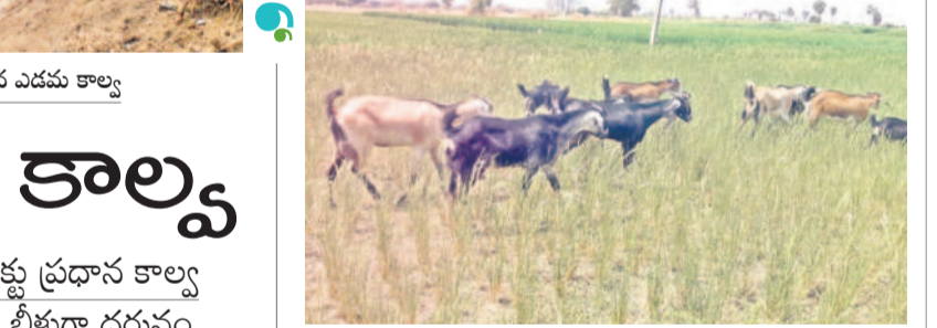
ఓబ్లాపూర్ లో మేకలకు మేతగా మారిన వరి పంట