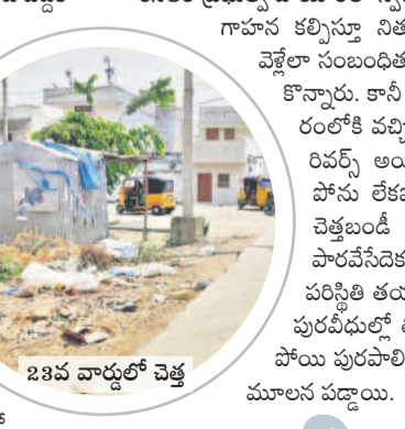
23వ వార్డులో చెత్త

కేసీఆర్ ప్రభుత్వ హయాంలో స్వచ్ఛతకు పెద్దపాటు వేస్తూ.. అవగాహన కల్పిస్తూ నిత్యం ఇంటింటికీ చెత్తబండి వెళ్ళేలా సంబంధిత అధికారులు చర్యలు తీసుకొన్నారు. కానీ కాంగ్రెస్ ప్రభుత్వంలో అధికారంలోకి వచ్చిన నాలుగు నెలల్లోనే సీన్ రివర్స్ అయ్యింది. వాహనాలు సరిపోను లేకపోవడంతో.. ఇప్పటికే మూడు ఆటోలను బండ్లపాకై పురపాలక కార్యాలయం వద్ద తుప్పనడుతున్నాయి. రోజు తప్పింది రోజు చెత్తసేకరణకు బండ్లను ఉపయోగిస్తున్నారు. ప్రజలు రోడ్లపై చెత్త వేయకుండా మున్సిపల్ సిబ్బందికి సహాయం చేయాలి.