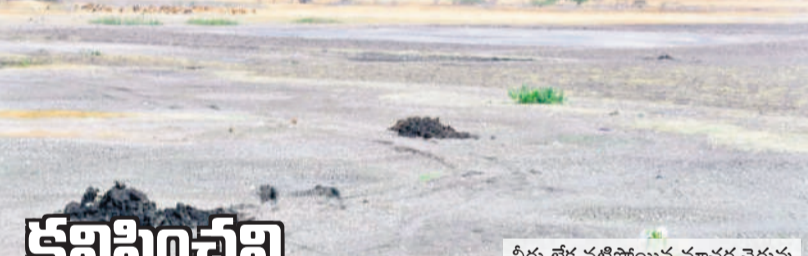
నీరు లేక పట్టిపోయిన మాచర్ల చెరువు