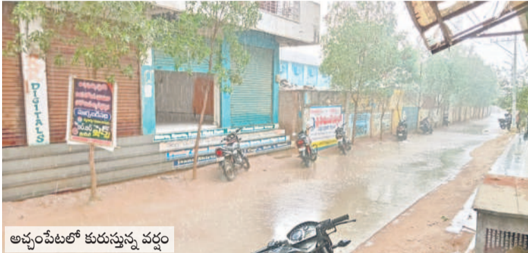
అచ్చంపేటలో కురుస్తున్న వర్షం