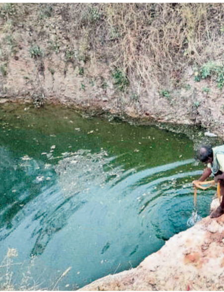
నీటి కొరతను తీసుకుంటున్న గ్రామస్థులు