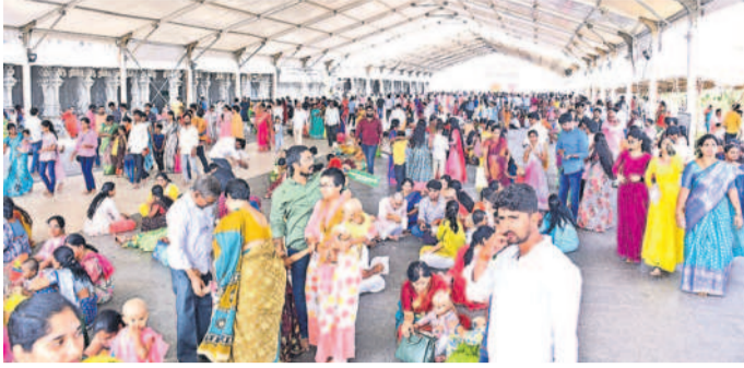
తిరుమాడవీధుల్లో భక్తుల కొలహాలం

యాదగిరిగుట్ట, ఏప్రిల్ 11: యాదగిరిగుట్ట లక్ష్మీనరసింహ స్వామి ఆలయంలో భక్తుల రద్దీ కొనసాగింది. గురువారం నిలబడిన కొండలతో పంచనారసింహుడి దర్శించుకు నేందుకు భక్తులు పెద్ద సంఖ్యలో వచ్చారు.