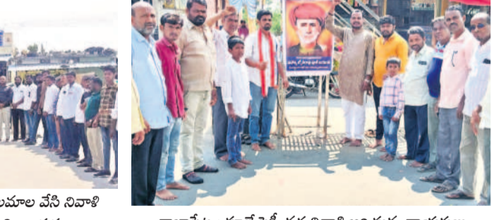
రాజాపేట: పూలే ఫ్లెట్ వద్ద నివాళి అర్పిస్తున్న నాయకులు