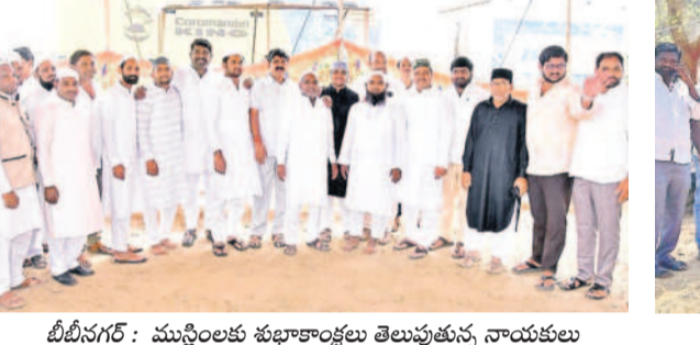
బీబీనగర్: ముస్లింలకు శుభాకాంక్షలు తెలుపుతున్న నాయకులు