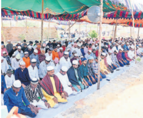
చౌటుప్పల్: లక్ష్మారం కథాహారలో ముస్లింల ప్రార్థనలు