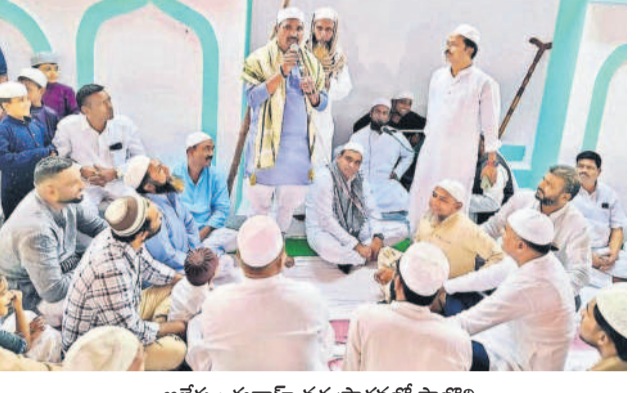
ఆలేరు: కథాహార వద్ద ప్రార్థనలో పాల్గొని మాట్లాడుతున్న ప్రభుత్వ వివ్ బీర్ల అయిలయ్య