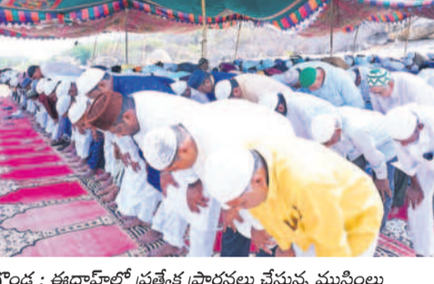
వలిగొండ: కథాహారలో ప్రత్యేక ప్రార్థనలు చేస్తున్న ముస్లింలు