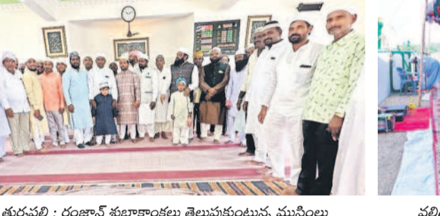
తుర్కపల్లి: రంజాన్ శుభాకాంక్షలు తెలుపుకుంటున్న ముస్లింలు