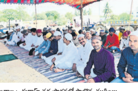
గుండాల: కథాహార వద్ద ప్రార్థనలో పాల్గొన్న ముస్లింలు