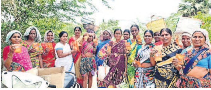
ఉపాధి హామీ కులీలకు ఓఆర్ఎస్ ప్యాకెట్ల అందజేస్తున్న వైద్య సిబ్బంది

ఆలేరు రూరల్, ఏప్రిల్ 11: కొలనుపాక ప్రాథమిక ఆరోగ్య కేంద్రం ఆధ్వర్యంలో గురువారం ఉపాధి హామీ కులీలకు ఓఆర్ఎస్ ప్యాకెట్ల పంపిణీ చేశారు. ఈ సందర్భంగా