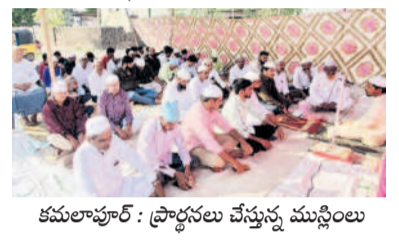
కమలాపూర్ : ప్రార్థనలు చేస్తున్న ముస్లింలు