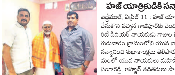
హజ్ యాత్రికుడికి సన్నాసం