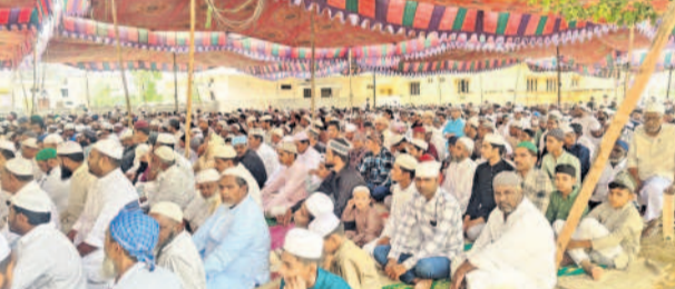
పరిగిలోని ఈద్దా వద్ద ముస్లింల ప్రత్యేక ప్రార్థనలు