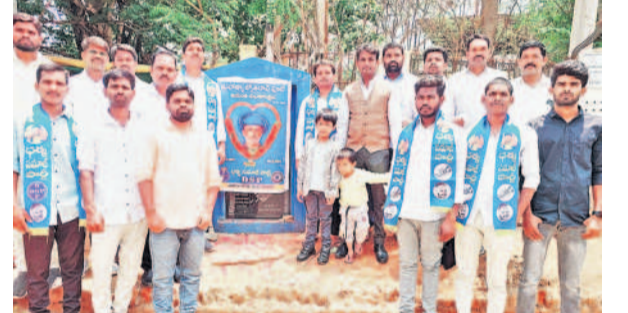
వికారాబాద్: పూలే జయంతి వేడుకల్లో పాల్గొన్న ధర్మ సమాజ్ పార్టీ నాయకులు