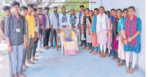
కొడంగల్లో ప్రజాసంఘాల నాయకులు, విద్యార్థులు..