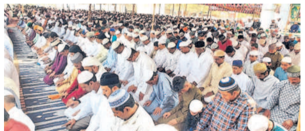
వికారాబాద్: అలంపల్లి దర్గా వద్ద ప్రార్థనలు చేస్తున్న ముస్లింలు