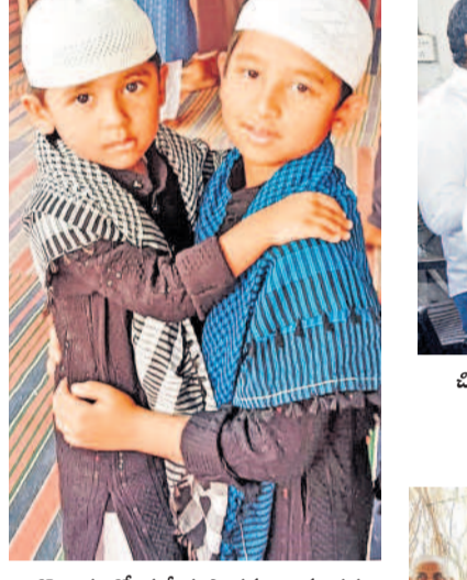
బోల్షారంలో ప్రత్యేక ప్రార్థనల అనంతరం బిన్నారలు అలింగనం చేసుకుంటూ శుభాకాంక్షలు తెలుపుతున్న దృశ్యం