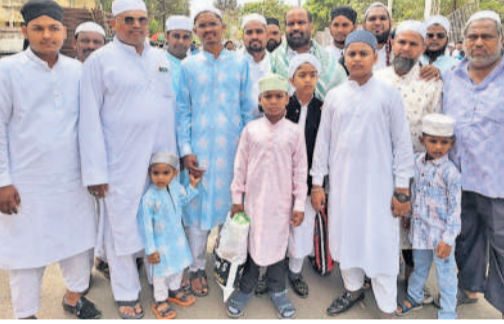
కంటోన్మెంట్లో ముస్లిం సోదరులకు శుభాకాంక్షలు తెలుపుతున్న రాష్ట్ర బేవరేజెస్ కార్పొరేషన్ మాజీ చైర్మన్ గజ్జెల నాగ్