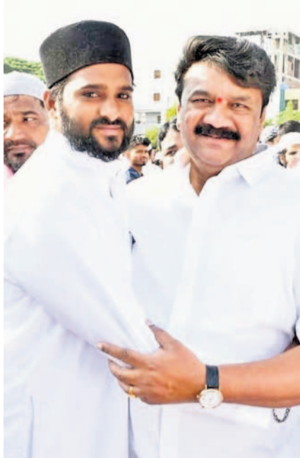
సనత్నగర్లో రంజాన్ సందర్భంగా ముస్లింలకు శుభాకాంక్షలు తెలుపుతున్న సనత్నగర్ ఎమ్మెల్యే తలసాని శ్రీనివాస్ యాదవ్

ముస్లింలకు శుభాకాంక్షలు తెలిపిన ఎమ్మెల్యే తలసాని శ్రీనివాస్ యాదవ్, కంటోన్మెంట్ బీఆర్ఎస్ ఎమ్మెల్యే అభ్యర్థి నివేదిత