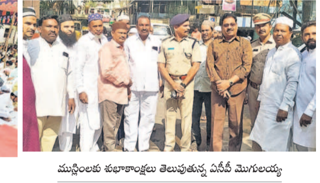
ముస్లింలకు శుభాకాంక్షలు తెలుపుతున్న ఏసీఐ మొగలయ్య