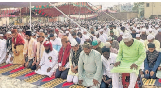
మియాపూర్ : అల్వీన్ కాలనీ డివిజన్లో ఈ దినం ప్రత్యేక ప్రార్థనలు చేస్తున్న మున్సింలు