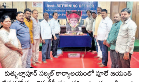
కుత్బుల్లాపూర్ సర్కల్ కార్యాలయంలో పూలే జయంతి వేడుకల్లో పాల్గొన్న డీసీ సర్వంహ, అధికారులు, నిబ్బంది