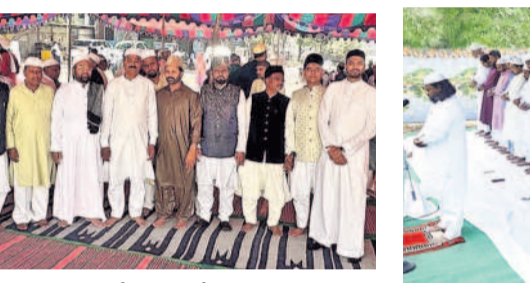
మియాపూర్ ఈ దినం ప్రాధాన్యతతో పాల్గొన్న పరీఫ్, మున్సిం సోదరులు