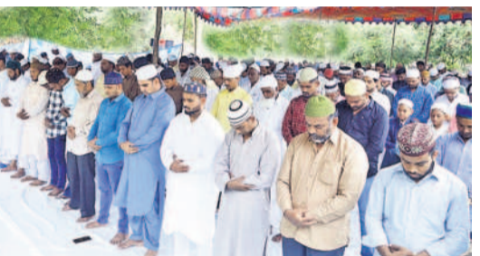
కొండాపూర్ : హుసేన్ పట్టేకు ఈ దినం ప్రాధాన్యత చేస్తున్న మున్సిం సోదరులు