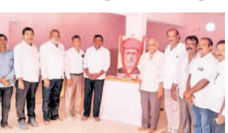
కేపీహెచ్ఐ కాలనీలో జ్యోతిరావు పూలే చిత్రపటం వద్ద నివాహించుకున్న నాయకులు