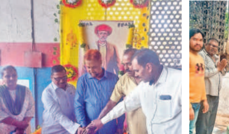
కూకట్‌పల్లి ఆర్టీసీ డిపోలో పూలే జయంతి సందర్భంగా కేటీ కట్ చేస్తున్న డీఎం జనాక, అధికారులు