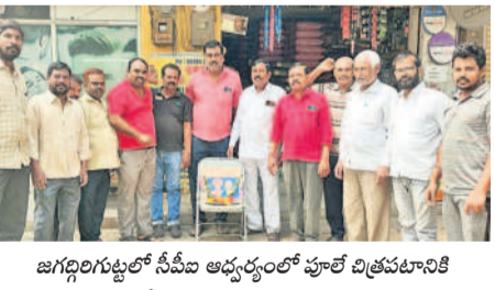
జగద్గిరిగుట్టలో సీపీఎం అధ్యక్షులతో పూలే చిత్రపటానికి పూలమాలలు వేసి నివాహించుకున్న ఆ పార్టీ నాయకులు