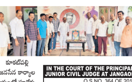
కూకట్‌పల్లి జనసేన కార్యాలయంలో పూలేకు నివాహించుకున్న ఆ పార్టీ నేతలు