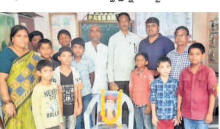
కొండాపూర్ : చందానగర్ తపస్వి ఫౌండేషన్ అనాధ శరణాలయంలో..