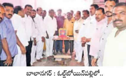
బాలానగర్ : ఓల్డ్ యేస్ పల్లో..