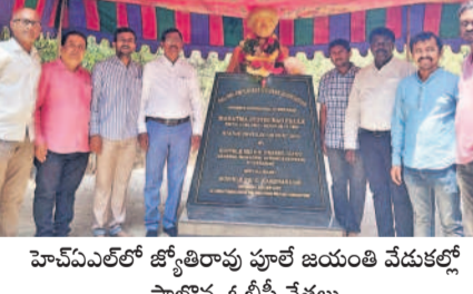
హైదరాబాద్ లో జ్యోతిరావు పూలే జయంతి వేడుకల్లో పాల్గొన్న డీసీసీ నేతలు