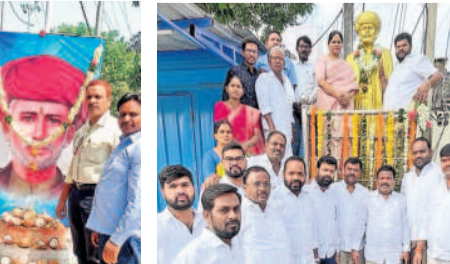
అల్లాపూర్ : హుసేన్ పట్టేకు పూలే చిత్రపటం వద్ద నివాహించుకున్న సర్వంహ, బస్టీవాసులు