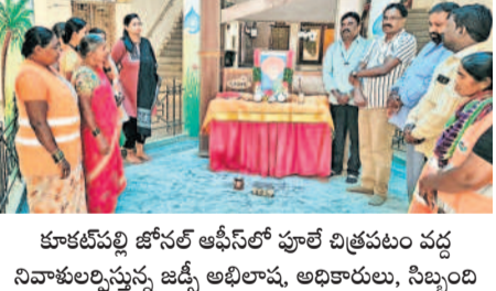
కూకట్‌పల్లి జ్యోతి ఆఫీస్ లో పూలే చిత్రపటం వద్ద నివాహించుకున్న జడ్పీ అధికారులు, నిబ్బంది