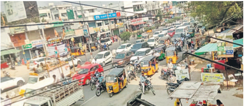
తుర్యయాంజాల్ చౌరస్తాలో ఉదయం సమయంలో సాగర్ రహదారిపై రద్దీ

తుర్యయాంజాల్, ఏప్రిల్ 10: రోడ్డు పాదచారులు ప్రమాదాలకు గురి కాకుండా రద్దీగా ఉండే చౌరస్తాలో పుట్ ఓవర్ బ్రడ్డిని నిర్మాణం చేపడుతారు. తుర్యయాంజాల్ మున్సిపల్ చౌరస్తాలో పుట్ ఓవర్ బ్రడ్డి లేక ప్రజలు తీవ్ర ఇబ్బందులు ఎదుర్కొంటున్నారు. కొన్నేండ్ల నుంచి తుర్యయాంజాల్ మున్సిపాలిటీ పరిధిలో వాహనాల రద్దీ పెరిగింది. దీంతో పాదచారులు రోడ్డు దాటతూ ప్రమాదాలకు గురి కావడంతో పాటు పలువురు మృత్యువాత పడిన ఘటనలు ఉన్నాయి. తుర్యయాంజాల్ చౌరస్తాలో ఉన్న సాగర్ ప్రధాన రహదారిని నిత్యం వందల సంఖ్యలో ప్రజలు దాటుతారు. సాగర్ ప్రధాన రహ