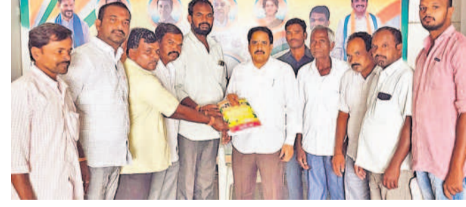
ఎమ్మెల్యేకు జాతర ఆహ్వాన పత్రికను అందజేస్తున్న అలయ కమిటీ సభ్యులు

కడపల్, ఏప్రిల్ 10 : మండల కేంద్రంలో కొలువుదీరిన ఈడమ్మతల్లి జాతర ఉత్సవాలకు ఈ నెల 16వ తేదీ నుంచి 18వ తేదీ వరకు జరుగుతున్నాయి. ఈ మేరకు హైదరాబాద్ నగరంలో కలెక్టర్ కసిరెడ్డి నాయకత్వంలోని బుధవారం అలయ కమిటీ