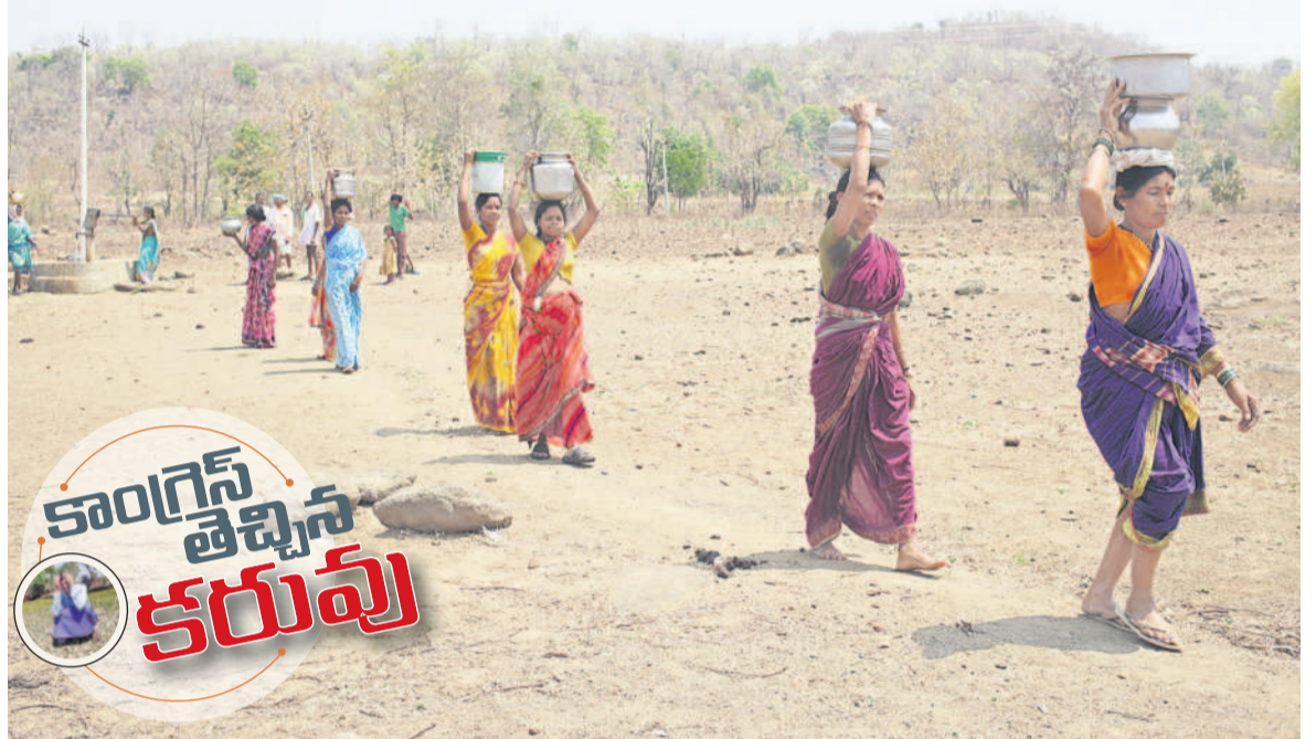
ఆదిలాబాద్ దూరల్ మండలంలోని దారీల్ గ్రామంలో బోర్డు నుంచి నీటిని తెచ్చుకుంటున్న గ్రామస్థులు