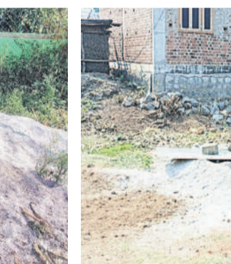
ఇటీవల వేసిన ఫియల్ అయిన మూడు బోర్డు