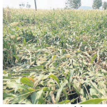
పొచ్చెర సమీపంలో నెలవాలిన జోన్న పంట

కుంటలలో, ఏప్రిల్ 10 : బలమైన గాలులతో కూడిన వర్షానికి కుంటలలోపాటు పలు గ్రామాల్లో చేతికొచ్చిన ముక్కజోన్న నేలమట్టమైంది. ఇంకా జోన్న, సువర్ణల పంటలు గాలుల తీవ్రతకు నెలకొనియాయి.