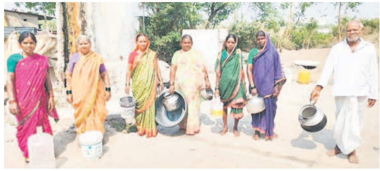
ముఖ్యోత్తర్ తాగునీటి కోసం ఖాళీ బండలతో నిరసన తెలుపుతున్న ప్రజలు

బైంసా, ఏప్రిల్ 10 : వేసవి ప్రారంభంలోనే ముఖ్యోత్తర్ నియోజకవర్గంలో తాగునీటి సమస్య తలెత్తింది. భూగర్భ జలాలు తగ్గముఖం పట్టడం, నీటి వనరులు వట్టి పోతుండడంతో గ్రామాల్లో తాగునీటి కొరత ఏర్పడుతున్నది. దీనికి తోడు గ్రామాల్లోని చేతి పంపులు పనిచేయకపోవడం, మరమ్మత్తులకు నోచుకోకపోవడంతో నీటి సమస్యకు దారి తీసింది. ప్రజలు తాగునీటి కోసం బోరుబావులను ఆశ్రయిస్తున్నారు. ముఖ్యోత్తర్ నియోజకవర్గంలోని ముఖ్యోత్తర్ మండలంలో ఒకటవ వార్డులో తాగునీటి సమస్య తీవ్రంగా ఉంది. దీంతో బుధవారం తాగునీటి కోసం ఖాళీ బండలతో క్యూలైన్ లో నిలబడ్డారు.