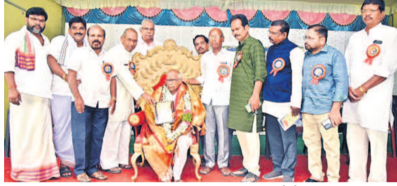
కూర్కే విలలాసాచార్యుల సన్మానోత్సవ కవులు, సాహితీ వేత్తలు