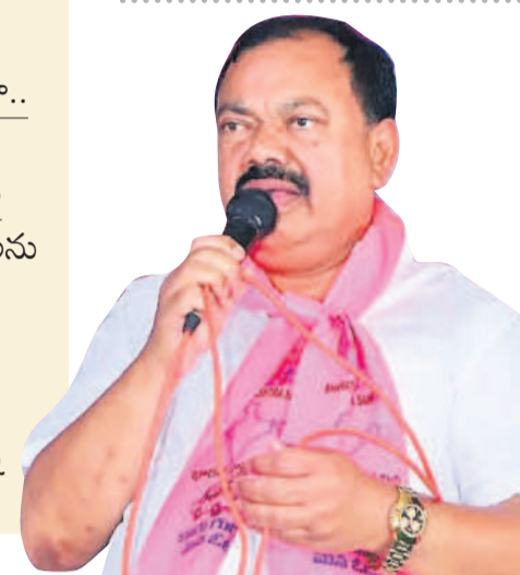
జోరుగా సన్నాహక సమావేశాలు