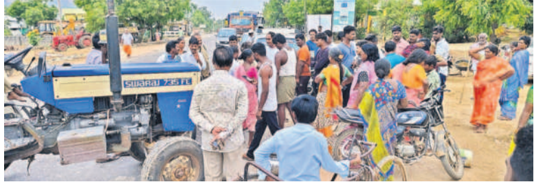
తిమ్మాపురంలో జనగాం - సూర్యాపేట జాతీయ రహదారిపై ధర్మా చేస్తున్న ప్రజలు

అర్జునపల్లి, ఏప్రిల్ 9 : 10 రోజులుగా మంచి నీళ్లు రావడం లేదని ప్రజలు మండలంలోని తిమ్మాపురం ఎక్స్ ప్రెస్ వద్ద పండుగ పూట మంగళవారం సూర్యాపేట - జనగాం జాతీయ రహదారిపై ధర్మా చేశారు. అధికారులు వెంటనే స్పందించి ట్యాంకర్ల ద్వారా నీటిని సరఫరా చేశారు.