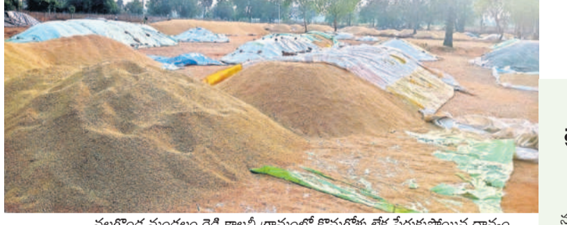
నల్లగొండ మండలం రెడ్డి కాలనీ గ్రామంలో కొనుగోళ్లు లేక పేరుకుపోయిన ధాన్యం

నల్లగొండ, ఏప్రిల్ 9 : యాసగిరి సీజన్ కు సంబంధించి ప్రభుత్వం ఏర్పాటు చేసిన కొనుగోళ్లు కేంద్రాల్లో ధాన్యం సేకరణ అరకొరగా సాగుతున్నది. దాదాపు అన్ని చోట్లా కేంద్రాల ప్రారంభమై కొనుగోళ్లు మండకొడిగా జరుగుతున్నాయి. ఈ నెల 1న కేంద్రాల అధికారికంగా మొదలైనా వారాల్లో అలసటగా అందుబాటులోకి వచ్చాయి. ధాన్యాన్ని కల్లాల్లో పోసి రైతులు ఎదురు చూస్తున్నారు. నల్లగొండ జిల్లాలో 5లక్షల మెట్రిక్ టన్నుల ధాన్యం అంచనాకు ఇప్పటి వరకు 38,596 మెట్రిక్ టన్నుల ధాన్యం కొన్నారు. గన్నీ బ్యాగుల కొరత కూడా అక్కడక్కడ ఉత్పన్నమవుతున్నది. గన్నీ బ్యాగుల కొరత లేకుండా చర్యలు చేపడుతున్నామని, కేంద్రాల్లో ధాన్యం కొనుగోళ్లు కూడా ఎప్పటికప్పుడే జరిగేలా చూస్తున్నామని నల్లగొండ సీఎల్ సబ్బే డీఎం నాగేశ్వర్ రెడ్డి తెలిపారు. సూర్యాపేట,