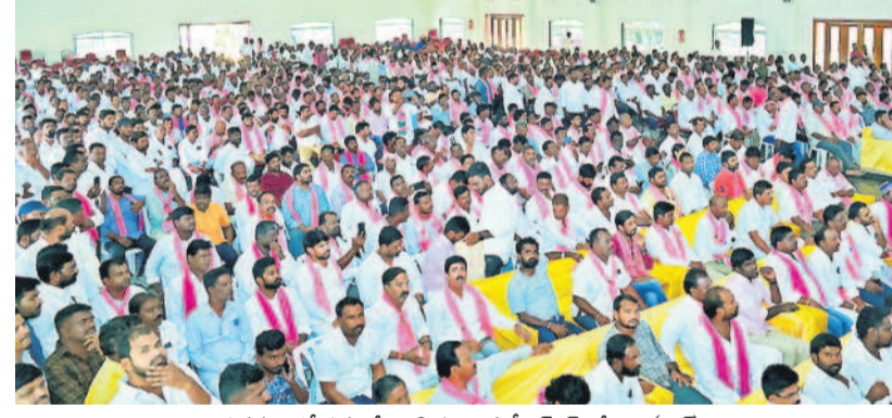
భువనగిరిలో సమావేశానికి హాజరైన బీఆర్ఎస్ శ్రేణులు (ఫైల్)

ఎన్నికల కోసం సన్నాహక సమావేశాల్లో కేడర్లను