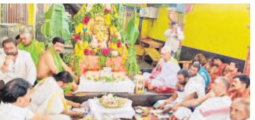
కొమురవెల్లి మల్లన్న శ్రీకృష్ణంలో పంచాంగం వినిపింపిస్తూ పండితులు