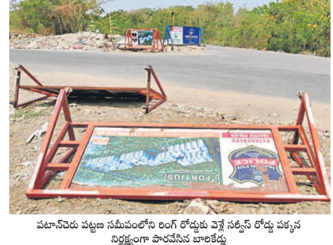
పటాన్చెరు పట్టణ సమీపంలోని లింగ రోడ్డుకు వెళ్లే సర్కిల్ రోడ్డు పక్కన నిర్లక్ష్యంగా పారవేసిన బారితేడ్లు