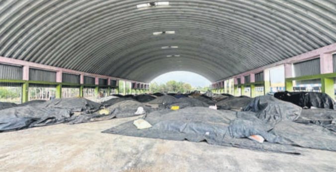
గజ్వేల్ మార్కెట్లో కొనుగోళ్లు నిర్దంగా ఉన్న పొద్దు తిరుగుడు కుప్పలు

గజ్వేల్, ఏప్రిల్ 9: ప్రభుత్వం నుంచి అనుమతి రాకపోవడంతో సిద్దిపేట జిల్లాలో పొద్దు తిరుగుడు కుప్పలు మార్కెట్లో కొనుగోళ్లు చేయడం లేదు. రైతులు పొద్దు తిరుగుడును నిల్వచేసి కొనుగోళ్ల కోసం ఎదురుచూస్తున్నారు. మార్కెట్లో అధికారులు సిద్దిపేట జిల్లాలో నెలకొని ఉన్న పొద్దుతిరుగుడు కొనుగోళ్లు కేంద్రాలను అందుబాటులోకి తెచ్చారు. మొదట కేంద్ర ప్రభుత్వ వాటా కొనుగోళ్లు అనుమతి రావడంతో కేంద్రం ఖరీదైనది. కేంద్రం వాటా పూర్వపదంతో మార్కెట్లో ఇంకా రైతులు పండించిన పొద్దు తిరుగుడు గింజలు అమ్మకానికి సిద్ధంగా ఉన్నాయి. వారం క్రితం నుంచి కొనుగోళ్లు నిలిచిపోవడంతో రైతులు పంటను ఎలా అమ్మకావాలని దిగులు చెందుతున్నారు. సిద్దిపేట జిల్లాలో 9,278 ఎకరాల్లో సాగు... సిద్దిపేట జిల్లాలో 16వేల మంది రైతులు 9,278 ఎకరాల్లో ఈసారి పొద్దుతిరుగుడు పంట సాగుచేశారు. కేంద్రం వాటా 2,029 మెట్రిక్ టన్నుల పొద్దుతిరుగుడు గింజలను