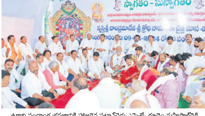
ఉగాది పంచాంగ శ్రవణానికి హాజరైన పటాన్చెరు ఎమ్మెల్యే గూడెం మహిపాలిరెడ్డి

పటాన్చెరు పంచాంగ శ్రవణంలో పురోహితులు హాజరైన ఎమ్మెల్యే మహిపాలిరెడ్డి