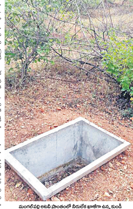
మంగల్ పల్లి అటవీ ప్రాంతంలోని సానరీపెట్లలో నీరులేక ఖాళీగా ఉన్న కుండీ

నీటి తోట్లకు ఆయా గ్రామపంచాయతీల నుంచి నల్లాల సౌకర్యాన్ని కూడా కల్పించారు. అయినప్పటికీ వాటి నిర్వహణ సరిగా లేక నీటి తోట్లలో చుక్క నీరు కూడా ఉండడంలేదు. దీంతో పక్షులు కూడా నీరు లేక దాహంతో విలవిలలాడుతున్నాయి. పక్షులు నీటి కోసం ఒక్కో గ్రామంలో రెండు నుంచి మూడు వరకు నీటి తోట్ల నిర్మాణం చేపట్టారు. ఈ నీటి తోట్ల నిర్మాణంతో పాటు పైపులైన్ల ద్వారా నల్లా కనెక్షన్ కూడా ఇచ్చినప్పటికీ వాటిలో నీరు నింపడంలేదు. దీంతో నీటి తోట్లు వృధాగా మారాయి. ఇబ్రహీంపట్నం డివిజన్ లోని ఆగపల్లి, నోముల, గున్ గల్, జాపాల, కాగజోపూర్, తులకలాన్, ఎలిమినేడు, కొంగరకాన్, కప్పాడు, పోచారం, దండుపాలారం, నాగనపల్లి, పోల్కపల్లి, రామపాల్, లింగంపల్లి, మంచాల, అరుట్ల రంగాపూర్ ప్రాంతాల్లో అటవీ ప్రాంతం పెద్ద ఎత్తున విస్తరించి ఉన్నది. ఈ అటవీ ప్రాంతాల్లో మూగజీవుల దప్పిక తీర్పును గత బీఆర్ఎస్ ప్రభుత్వ హయాంలో సూతనంగా సానరీపెట్లను ఏర్పాటు చేశారు. గతంలో ప్రతి ఏడాది వేసవికాలంలో మూగజీవుల దప్పిక తీర్పును ప్రభుత్వం ప్రత్యేకంగా ట్యాంకర్ల ద్వారా