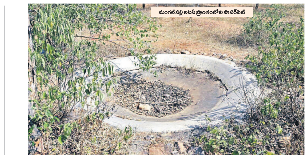
మంగల్ పల్లి అటవీ ప్రాంతంలోని సానరీపెట్