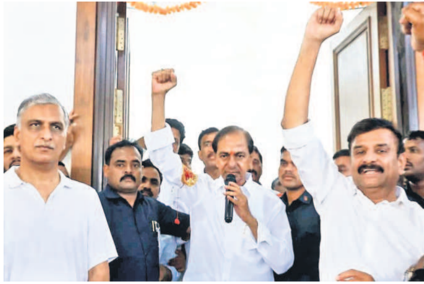
సిద్దిపేట జిల్లా ఎర్రపల్లిలోని తన నివాసానికి తరలివచ్చిన బీఆర్ఎస్ శ్రేణులు, అభిమానులకు ఉగాది వండుగు శుభాకాంక్షలు తెలుపుతూ అభివాదం చేస్తున్న అధినేత కేసీఆర్. వక్రవ హతీ, కొత్త ప్రభాకర్ రెడ్డి