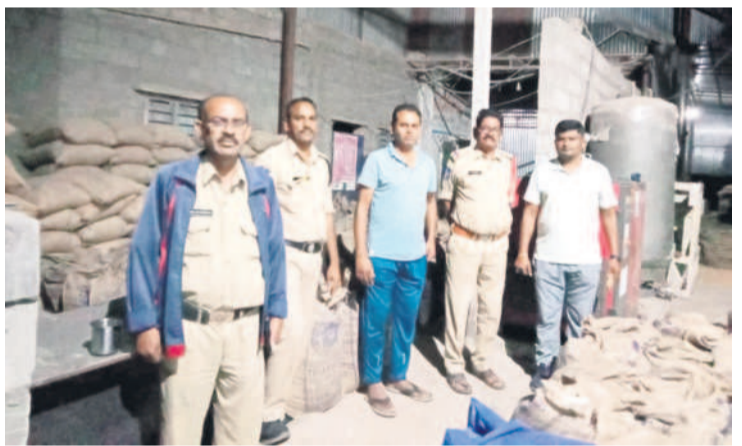
మిల్లల్ తనీషీ చేస్తున్న ట్యాంప్ డ్యాం, స్పెషల్ ట్రాంప్ పోలీసులు