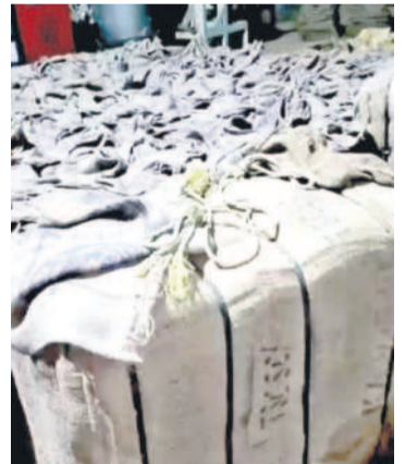
మిల్లల్ వీడిఎస్ బియ్యం బ్యాగులు