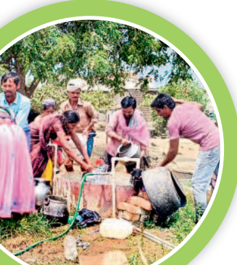
నీళ్ళ పట్టుకుంటున్న తండా ప్రజలు

బాసుతండావాసులకు మళ్ళీ మొదలైన కష్టాలు బందెడు నీళ్ళ కోసం వ్యవసాయ బావుల వద్దకు పరుగులు పట్టించుకొని అధికారులు