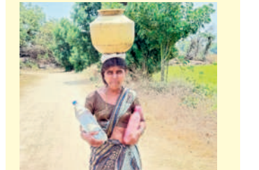
ఇంటి ముందు చల్లదానికి నీళ్ళ లేవు

పొద్దున్నే వరి కోతకు వెళ్ళి ఇంటికి వచ్చినందుకు నీళ్ళ కోసం గొడ్డు అరుస్తున్నాయి. ఆకలవుతుందని అన్నం వండుకుంటుంటే నీళ్ళ లేవు. పొద్దున 6 గంటలకు పనికి వెళ్ళి మధ్యాహ్నం 12 గంటలకు ఇంటికి వచ్చినా, ఇంట్లో చుక్కెముక్క నీళ్ళ లేకపోవడంతో పొలం వద్దకు వచ్చి పట్టుకుపోతున్నా. ఉగాది పండుగ రోజు ఇంటి ముందు చల్లదానికి నీళ్ళ లేవు. పొలాలకి వెళ్ళి నీళ్ళ కోసం పోతే పొలం పారడం లేదని వాళ్ళ గొడవ చేస్తున్నారు. మమ్మలను ఎవరూ పట్టించుకోవడం లేదు.