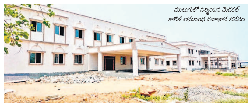
ములుగులో నిర్మించిన మెడికల్ కాలేజీ అనుబంధ దవాఖాన భవనం