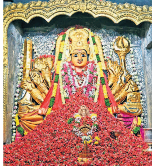
వరంగల్ : లక్షా గులాబీలతో భద్రకాళి అమ్మవారికి పుష్పార్చన

ఉగాది వేళ అమ్మవారి దర్శనానికి పోటిత్తిన భక్తులు