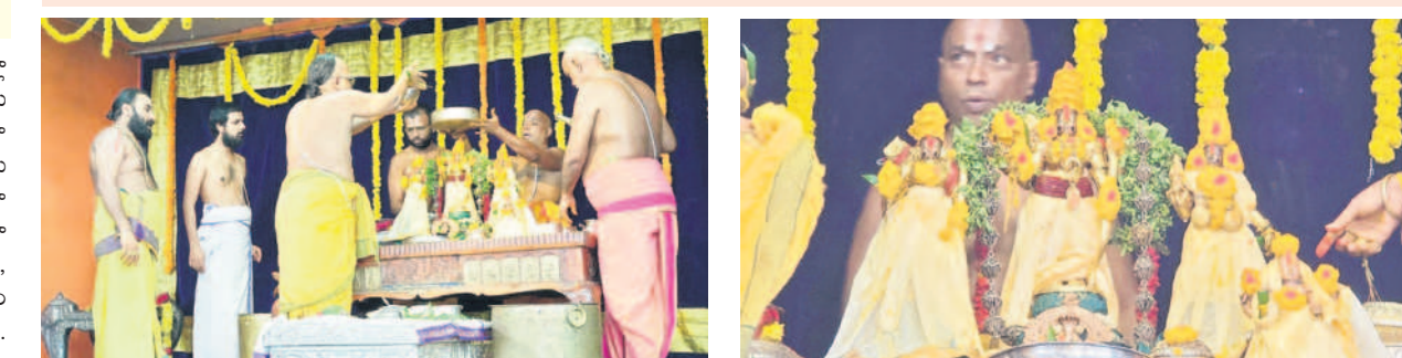
భద్రాచలంలోని శ్రీ సీతారామచంద్రస్వామి ఆలయంలో ఉత్సవమూర్తులకు సహస్రధారలతో అభిషేకం చేస్తున్న అర్చకులు