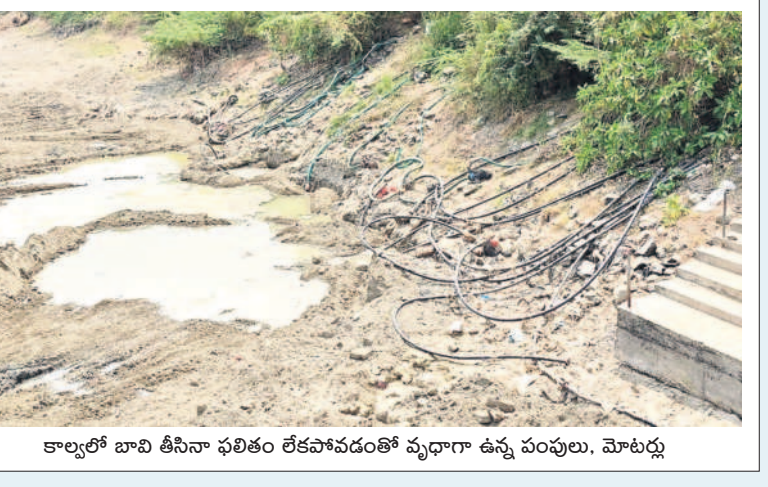
కాల్యలో బావి తీసినా ఫలితం లేకపోవడంతో వృధాగా ఉన్న పంటలు, మోటర్లు

ఆదవా దడపా లక్ష్యమైన నీటితో కొంతకాలం నెట్టుకొచ్చారు. ప్రస్తుతం ఎండిలు ముదరడంతో కాలాల్లో తవ్విన బావులను సైతం ఎండిపోవడంతో రైతులు చేతులెత్తేశారు. కంకులు పోసుకునే దశలోనే పంట పూర్తిగా ఎండిపోవడంతో సాగు రైతులు తీవ్ర ఆందోళనకు గురవుతున్నారు. వానకాలం సీజన్లో అదే భూమిలో పత్తి సాగు చేసిన రైతులకు చీడమీడల బెడద వల్ల కనీసం పెట్టుబడి కూడా రాని పరిస్థితి నెలకొంది. దీంతో పత్తి పంటను తొలగించిన రైతులు దాని స్థానంలో మక్కసాగు చేశారు. తీరా పంట చేతికొచ్చే సమయంలో నీటి ఎద్దడి తలెత్తడంతో రైతులు తలలు పట్టుకునే పరిస్థితి వచ్చింది. వానకాలం పత్తి పంటకు చీడమీడల బెడద, యాసంగిలో మొక్కజొన్న పంటకు నీటి ఎద్దడి వల్ల రెండు సీజన్లలో పూర్తిగా నష్టపోయామని, ప్రభుత్వం పరివహరం అందించి ఆదుకోవాలని సాగు రైతులు కోరుతున్నారు.