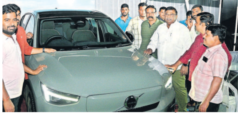
స్టాలో వోల్టేజీ కారును పరిశీలిస్తున్న సర్కారు అధికారులు. జడ్పీ చైర్మన్ బండ నరేందర్ రెడ్డి, సమస్తి తెలంగాణ ప్రతినిధులు