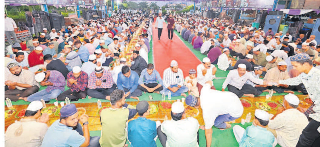
సిద్దిపేటలో ఇఫ్తార్ విందుకు హాజరైన ముస్లింలు