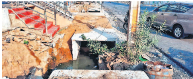
చేర్యాలలో డ్రైనేజీ నిర్మాణ పనులు నిలిపివేయడంతో ఏర్పడిన మురుగు గుంట

చేర్యాల, ఏప్రిల్ 7: చేర్యాల పట్టణంలో చేపడుతున్న జాతీయ రహదారి నిర్మాణ పనులతో జనానికి ఇబ్బందులు తప్పడం లేదు. హైవే పనుల్లో బాగం రోడ్డుకు ఇరువైపులా 8 నెలల క్రితం డ్రైనేజీల నిర్మాణం కోసం గుంతల తవ్వారు. గుంతల వద్ద అసంపూర్ణ పనులతో అందులో మురుగు నీరు పరిసరాల దుర్భంధంగా మారి దోమలు సైరం విహారం చేస్తున్నాయి. దీంతో ప్రజలు ఆనారోగ్యానికి గురవుతున్నారు. హైవే నిర్మాణ పనులు ప్రజా ప్రకారం చేయకపోవడంతో ఇబ్బందులు ఎదురవుతున్నాయని, మున్సిపల్ అధికారులతో పాటు నేషనల్ హైవే అథారిటీ (ఎన్హెచ్ ఏఐఐ) అధికారులు పట్టించుకోవడం లేదని ప్రజలు ఆరోపిస్తున్నారు. సూర్యాపేట-సిరికాండ్ల రహదారి పనులు చేర్యాల పట్టణంలో కొన్ని నెలలుగా కొనసాగుతున్నాయి. రోడ్డు పనుల్లో బాగంగా మొదటగా కాండ్ల క్లర్ పట్టణంలోని రోడ్డుకు ఇరువైపులా పెద్ద డ్రైనేజీలు నిర్మిస్తున్నారు. ఇందుకోసం నివాస గృహాలు, దుకాణాల మండలం రెండు వైపుల పెద్దపెద్ద గుంతలు తీస్తున్నారు. ఈ గుంతలు ఒక్కోచోట ఒక్కో తీస్తుండడంతో ప్రజలు