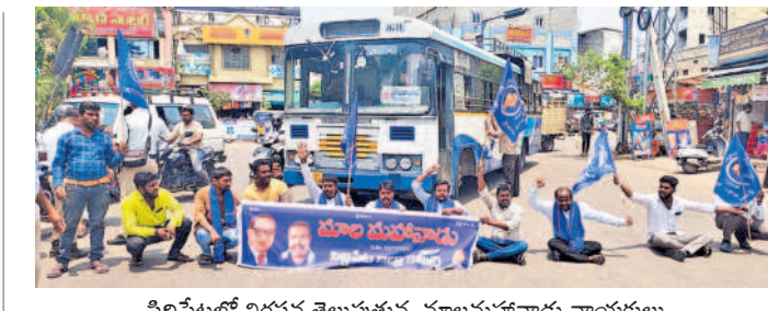
సిద్దిపేటలో నిరసన తెలుపుతున్న మాలమహానాడు నాయకులు