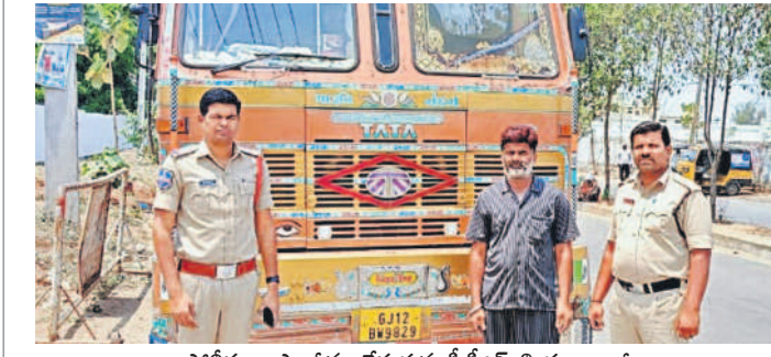
పోలీసులు స్వాధీనం చేసుకున్న పీడిఎస్ బియ్యం లాల్