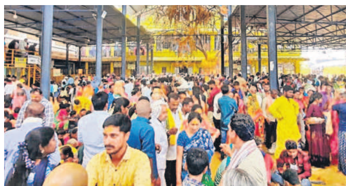
గంగరేగు చెట్టు ఆవరణలో భక్తుల రద్దీ

అభ్యంతరం వ్యక్తం చేస్తున్నారు. మురుగు గుంటలుగా మాత్రం డ్రైనేజీ స్తంభాలు ఉన్నాయనే సాకుతో కాండ్ల క్లర్ అక్కడక్కడా పనులు చేయకుండా వదిలిపెట్టడంతో ఇంకొక సుందీ వచ్చిన నీళ్లతో మురుగు నీరు పోయి దోమలు పెరిగాయి. దోమల నివారణకు మున్సిపల్ అధికారులు ఎలాంటి చర్యలు తీసుకోవడం లేదు. అసంపూర్ణ పనులు, డ్రైనేజీ కంప్లెట్ చేయకపోవడం వల్ల ప్రజలకు అనభవం వస్తున్నారని, రోడ్డు పనులు చేస్తున్న కాండ్ల క్లర్ కొన్నింటిని విద్యుత్ స్తంభాలను వదిలిపెట్టి నిర్మాణ పనులు కొనసాగిస్తున్నారని, డ్రైనేజీ నిర్మాణ సమయంలో కాండ్ల క్లర్ కింద పనిచేసేవారికి డబ్బులు ముట్టచెలితే విద్యుత్ స్తంభం ఉన్నచోటే దానిని అనుకుని డ్రైనేజీ నిర్మిస్తున్నారని ప్రజలు ఆరోపిస్తున్నారు. కొన్నిచోట్ల విద్యుత్ స్తంభాలు ఉన్నాయని పనులు నిలిపివేసి మరోచోట పనులు చేస్తుండడం గమనార్హం. మున్సిపల్, ఎన్హెచ్ఏఐఐ అధికారులు స్పందించి చర్యలు తీసుకోవాలని ప్రజలు కోరుతున్నారు.