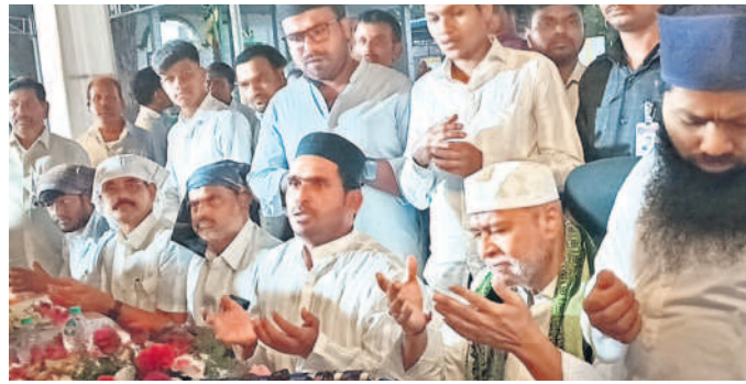
ఇఫ్తార్ విందులో పాల్గొన్న మంత్రి దామోదర రాజనర్సింహ

• వైద్యారోగ్య శాఖ మంత్రి దామోదర రాజనర్సింహ