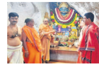
మల్లన్న ఆలయంలో అర్చకుల పూజలు