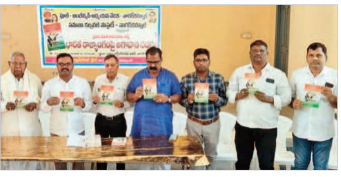
పుస్తకావిష్కరణ సభలో వక్తలు