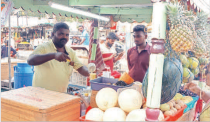
కల్వకుర్తి పట్టణంలో పళ్లకసానితో సేద తీరుతున్న ప్రజలు

పళ్లకసాని తాగుతున్న ప్రజలు... మరో వైపు దావోద్రిక ప్రజలు గురవ్వాలి. దీంతో కొద్ది రోండాలు కూల్చివేసి, బిస్కెట్, నిమ్మరసం, మజ్జిగ్ అమ్మకం తీసుకుంటారు. కొద్ది రోండాలు ధరలు ఆకాశంబయ్యడంతో దావోద్రిక తగ్గించుకోవడానికి మెల్లమెల్లగా పళ్లకసాని వైపు అడుగులు వేస్తున్నారు.