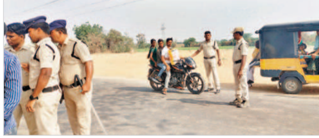
వాహనాలను తనిఖీ చేస్తున్న పోలీసులు