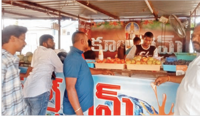
పళ్లకసాని తాగుతున్న ప్రజలు