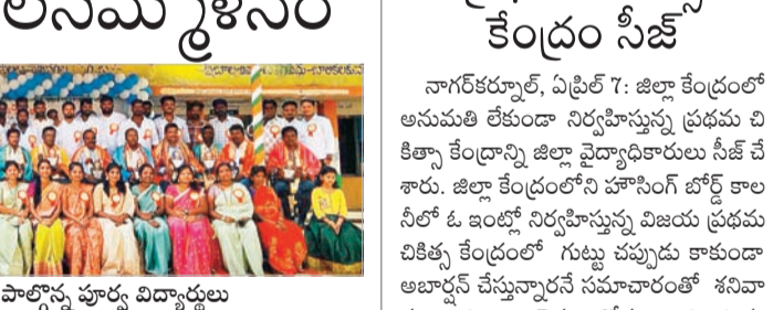
పెద్దాపూర్ ఉన్నత పాఠశాలలో పాల్గొన్న పూర్వ విద్యార్థులు

వెల్లండ్, ఏప్రిల్ 7: మండలంలోని పెద్దాపూర్ ప్రభుత్వ ఉన్నత పాఠశాలలో 2010-11 బ్యాచ్ వడో తరగతి విద్యార్థులు పూర్వ విద్యార్థుల సమ్మేళనం పునంగా నిర్వహించారు. ప్రశాంతంగా మోడల్ ప్రవేశ పరీక్షలు వెల్లండ్, ఏప్రిల్ 7: మండల కేంద్రంలోని ఆదివారం మోడల్ సెంటర్ ఎంట్రిన్స్ పరీక్షలు ప్రశాంతంగా జరిగాయి. 6 వ తరగతిలో ప్రవేశ