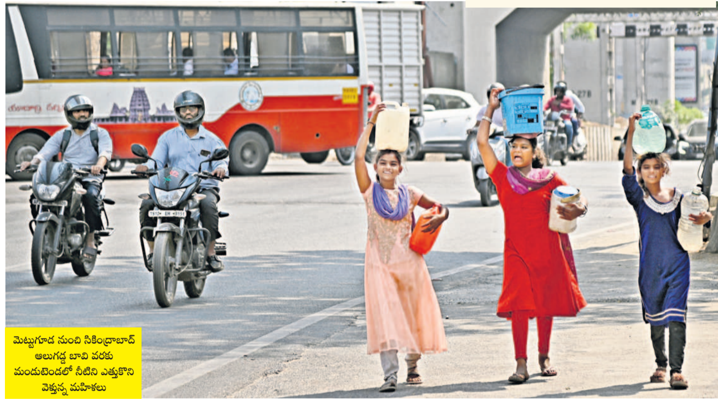
మెట్టగూడ నుంచి సికింద్రాబాద్ అలుగడ్ల బావి వరకు ముందుకుపోతే నీటిని ఎత్తుకొని వెళ్తున్న మహిళలు