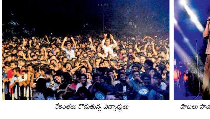
కేలంతులు కొడుతున్న విద్యార్థులు