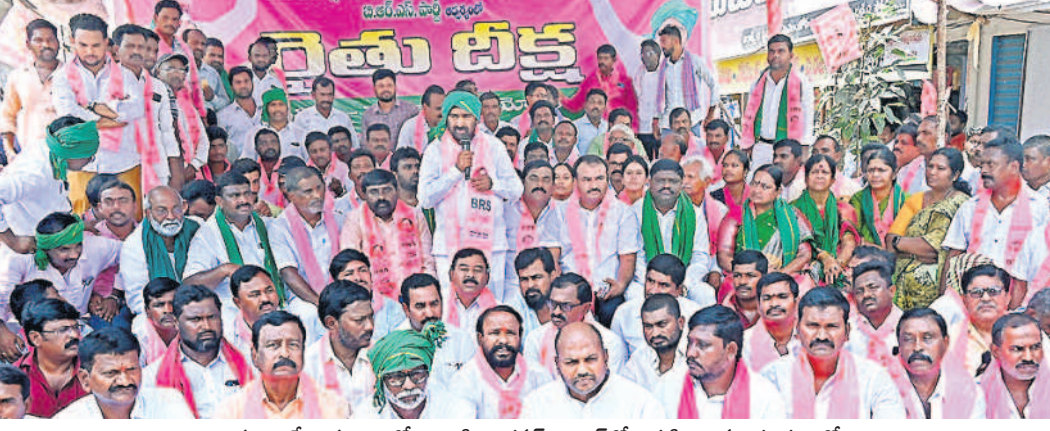
సూర్యాపేట పట్టణంలోని వాణిజ్య భవన్ సెంటర్లలో నిర్వహించిన రైతు ధర్సాలో మాట్లాడుతున్న మాజీ మంత్రి, స్థానిక ఎమ్మెల్యే గుంటకండ్ల జగబీశ్రరెడ్డి

ఇవేమీ పట్టని ముఖ్యమంత్రి రేవంత్రెరెడ్డితో