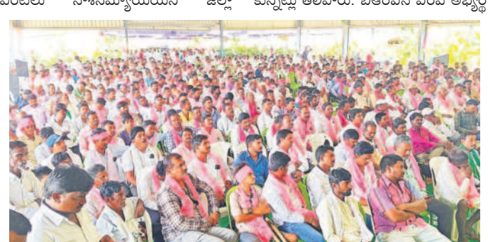
సమావేశానికి హాజరైన బీఆర్ఎస్ (శేణులు

డ్రుతి కార్యకర్త సైనికుడిగా పని చేస్తూ శక్తి వంచన లేకుండా పని చేయాలని తుంగతుర్తి మాజీ ఎమ్మెల్యే గాదరి కిశోర్కుమార్ అన్నారు. కాంగ్రెస్ ప్రజలకు మాయ మాటలు చెప్పి అధికారంలోకి వచ్చిందన్నారు. రాహు ల్గాంధీ సంతకాన్ని ఫ్లోర్జరీ చేసిన వ్యక్తిని కాంగ్రెస్ పార్టీ దిక్కులేక వారినే అభ్యర్థిగా పెట్టు కున్నట్లు తెలిపారు. బీఆర్ఎస్ ఎంపీ అభ్యర్థి