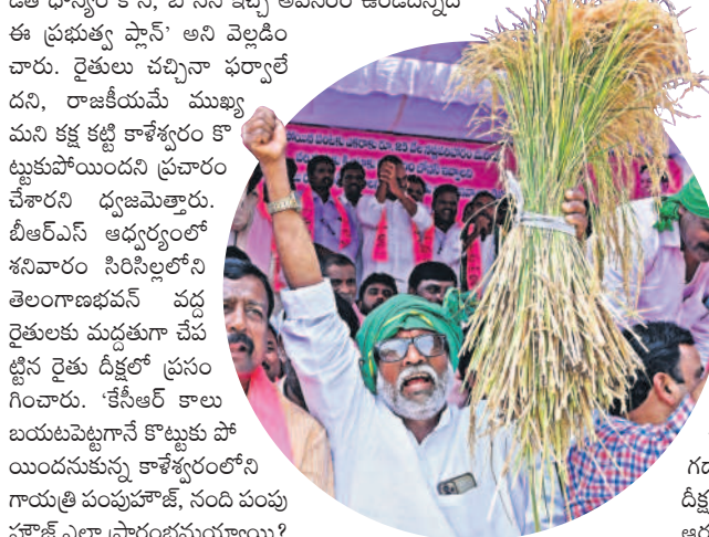
సూర్యాపేటలో రైతు దీక్షలో వరి కంటలతో నిరసన తెలుపుతున్న రైతు