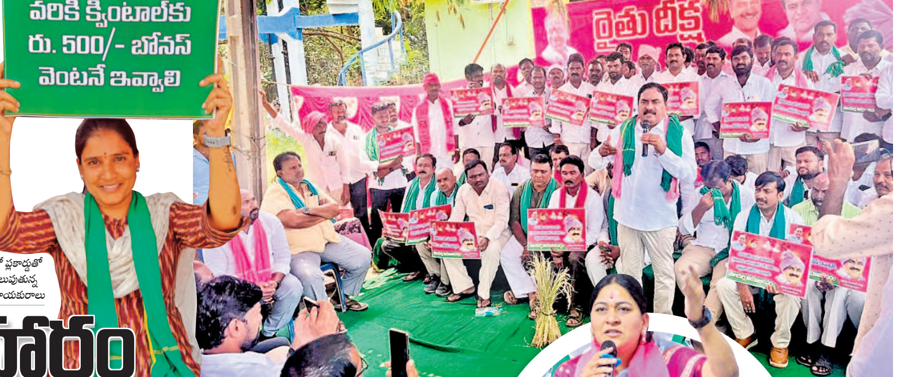
జనగామలో ప్రకారంతో నిరసన తెలుపుతున్న బీఆర్ఎస్ నాయకులు