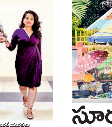
ఫ్యాషన్ షోలో యువతీయువకులు