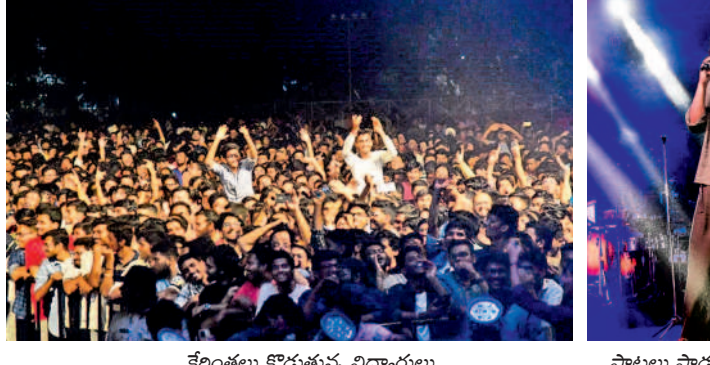
కేలంతులు కొడుతున్న విద్యార్థులు