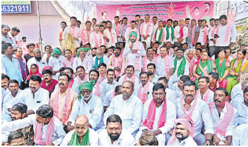
అన్నదాతకు అండగా.. సూర్యాపేట పట్టణంలోని వాణిజ్య భవన్ సుంటర్లో చేపట్టిన రైతు ధర్మాల్లో మాట్లాడుతున్న మాజీ మంత్రి, స్థానిక ఎమ్మెల్యే జగదీశ్ రెడ్డి