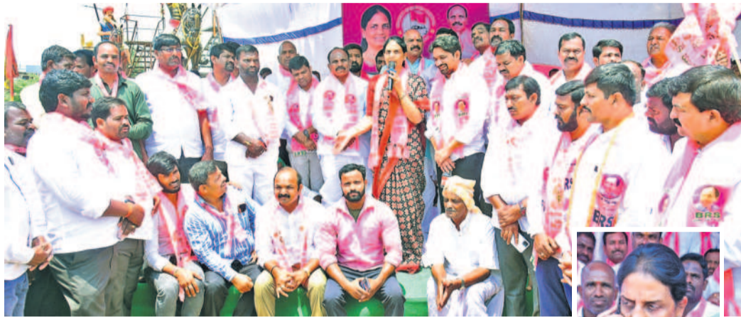
రంగాపెట్ల జిల్లా చేవెళ్లలో నిర్వహించిన నిరసనలో ప్రసంగిస్తున్న మాజీ మంత్రి, ఎమ్మెల్యే నవితారెడ్డి. చిత్రంలో ఎమ్మెల్యే కాలి యాదయ్య తలతరులు. (జనసభ) విద్యుత్ కోతతో మైక్ పనిచేయకపోవడంతో కరెంటు అధికారులకు ఫోన్ చేసి వివరాలు తెలుసుకుంటున్న నవిత.