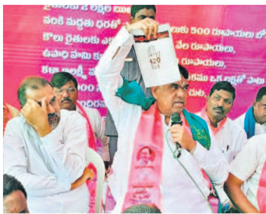
కామారెడ్డి జిల్లా బాన్సువాడలో నిర్వహించిన రైతుదీక్షలో మాజీ స్పీకర్ పోచారం శ్రీనివాసరెడ్డి