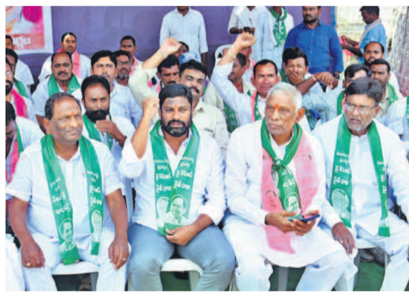
మంచిర్యాల దీక్షలు నివాదాలు చేస్తున్న మాజీ విప్ బాల్కా సుమన్, మాజీ మంత్రి కొప్పల ఈశ్వర్, మాజీ ఎమ్మెల్యే దివాకరరావు