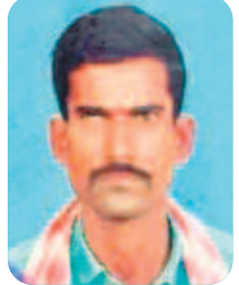
శ్రీశైలం (80) మహబూబ్ నగర్ జిల్లా