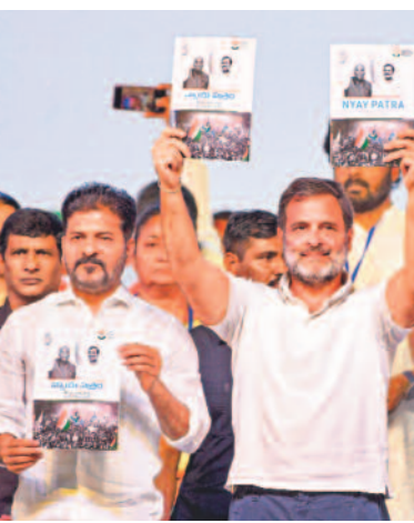
తుక్కుగూడలో శనివారం జరిగిన కాంగ్రెస్ జనజాతర సభలో పార్టీ మ్యానిఫెస్టోను ప్రదర్శిస్తున్న రాహుల్ గాంధీ, సీఎం రేవంత్ రెడ్డి

హైదరాబాద్, ఏప్రిల్ 6 (నమస్తే తెలంగాణ): అధికారంలోకి వచ్చి కనీసం నాలుగు నెలలు కూడా పూర్తి కాలేదు.. జాతీయ పార్టీ మాజీ అధ్యక్షుడు రాహుల్ గాంధీ సహా ముఖ్యమంత్రి, మంత్రులు కొలువుదీరిన సభా ప్రాంగణం.. కాంగ్రెస్ పార్టీకి జాతీయ స్థాయిలో చావో రేవో అన్నట్లుగా మారిన పార్లమెంటు ఎన్నికలు.. వీటి న్నింటికి మించి అసెంబ్లీ ఎన్నికల సమయంలో అచ్చి వచ్చిన వేదిక.. ఇలాంటి కీలక పరిణామాల మధ్య లోక్ సభ ఎన్నికల ముంగిట కాంగ్రెస్ పార్టీ శనివారం చేపట్టిన జన జాతర ఉసురు మసకే లింది. పాలనా యంత్రాంగం సహకారంతో కరువు పరిస్థితులను సైతం పక్కనబెట్టి మనసు