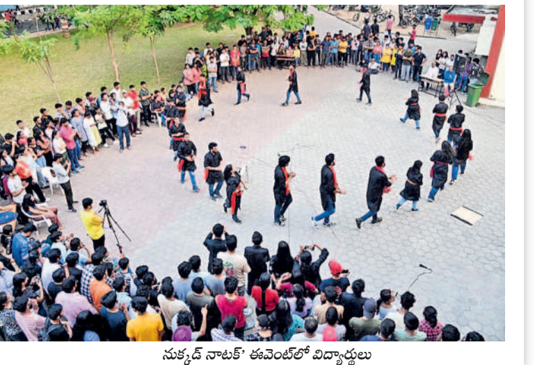
సుకృద్ నాటివ్ ఈవెంట్లో విద్యార్థులు