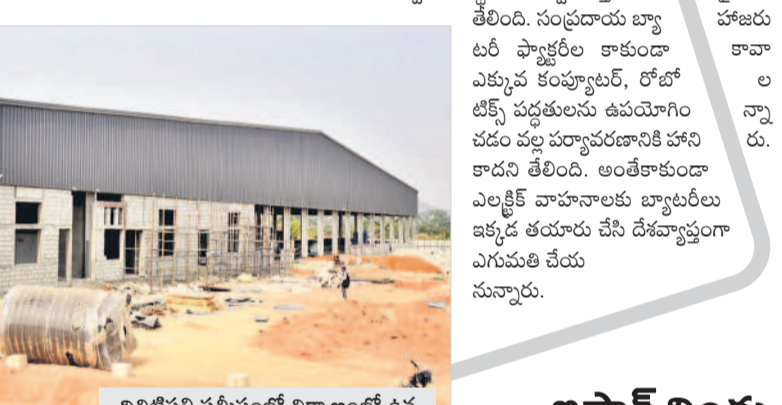
ఐటిపల్లి సమీపంలో నిర్మాణంలో ఉన్న అమరరాజా లిథియం బ్యాటరీ కంపెనీ

కాలువ్యు రహితంగా ఉంటుంది గత ప్రభుత్వం వెనుకబడిన మహబూబ్ నగర్ జిల్లాలో ఈ ఫ్యాక్టరీ ఏర్పాటు చేయాలని నిర్ణయించింది. ముడి పదార్థాలు పర్యావరణ అనుకూల వనరుల నుంచి తీసుకుంటాయని నిర్ధారించింది. కార్బన్ ఫుట్ ప్రింట్ ను తగ్గించడానికి సౌర, పవన శక్తి (సోలార్ అండ్ విండ్ పవర్) వంటి పునరుత్పాదక ఇంధన వనరులను కూడా ఉపయోగించడంతో కాలువ్యు పూర్తిగా తగ్గనున్నది. గిగా ఫ్యాక్టరీల సర్దుబాటు వాల్యూ చెయ్యిని అనుసరిస్తాయి. ఇందులో ఉపయోగించిన పదార్థాలు వృధా కాకుండా రీసైకిల్ చేయబడతాయి. అదనంగా అలోమేషన్ ద్వారా సుస్థిరతను సృష్టించేలా తియింది. సుప్రధాన బ్యాటరీ ఫ్యాక్టరీల కాకుండా ఎక్కువ కంప్యూటర్, రోబోటిక్స్ పద్ధతులను ఉపయోగించడం వల్ల పర్యావరణానికి హాని కాదని తెలిసింది. అంతేకాకుండా ఎలక్ట్రిక్ వాహనాలకు బ్యాటరీలు ఇక్కడ తయారు చేసే దేశవ్యాప్తంగా ఎగుమతి చేయనున్నారు.