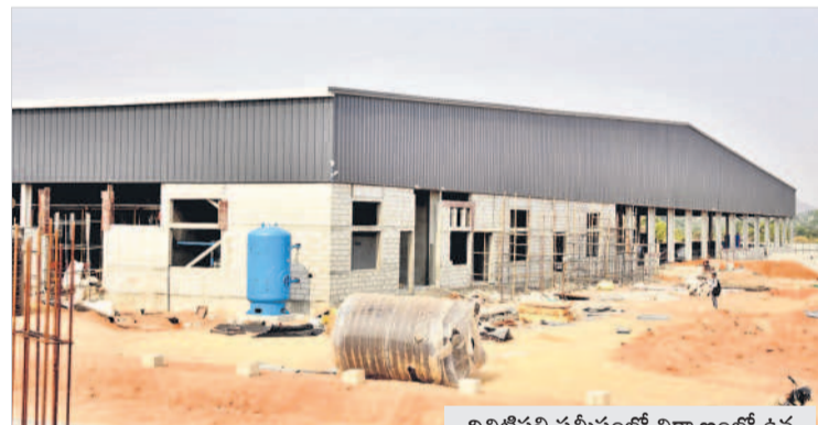
లిథియం గిగా ఫ్యాక్టరీ వద్దని కొన్ని రోజులుగా కొందరు అందోళ్లకు దిగుతున్నారు. కానీ పూర్తిగా

కాలువ్యు రహితంగా ఉంటుంది గత ప్రభుత్వం వెనుకబడిన మహబూబ్ నగర్ జిల్లాలో ఈ ఫ్యాక్టరీ ఏర్పాటు చేయాలని నిర్ణయించింది. ముడి పదార్థాలు పర్యావరణ అనుకూల వనరుల నుంచి తీసుకుంటాయని నిర్ధారించింది. కార్బన్ ఫుట్ ప్రింట్ ను తగ్గించడానికి సౌర, పవన శక్తి (సోలార్ అండ్ విండ్ పవర్) వంటి పునరుత్పాదక ఇంధన వనరులను కూడా ఉపయోగించడంతో కాలువ్యు పూర్తిగా తగ్గనున్నది. గిగా ఫ్యాక్టరీల సర్దుబాటు వాల్యూ చెయ్యిని అనుసరిస్తాయి. ఇందులో ఉపయోగించిన పదార్థాలు వృధా కాకుండా రీసైకిల్ చేయబడతాయి. అదనంగా అలోమేషన్ ద్వారా సుస్థిరతను సృష్టించేలా తియింది. సుప్రధాన బ్యాటరీ ఫ్యాక్టరీల కాకుండా ఎక్కువ కంప్యూటర్, రోబోటిక్స్ పద్ధతులను ఉపయోగించడం వల్ల పర్యావరణానికి హాని కాదని తెలిసింది. అంతేకాకుండా ఎలక్ట్రిక్ వాహనాలకు బ్యాటరీలు ఇక్కడ తయారు చేసే దేశవ్యాప్తంగా ఎగుమతి చేయనున్నారు.