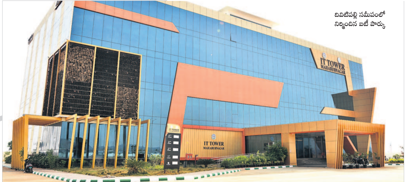
ఐటిపల్లి సమీపంలో నిర్మించిన ఐటీ టవర్