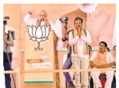
కాగజ్ నగర్ లో మాట్లాడుతున్న అమిత్ షా

ఆసిఫాబాద్, మే 5 : కుటుంబ టీం ఆసిఫాబాద్ జిల్లా కాగజ్ నగర్ పట్టణంలో ఆదివారం నిర్వహించిన వికాస సంకల్ప యాత్రలో కేంద్ర హోంశాఖ మంత్రి అమిత్ షా పాల్గొన్నారు. ముందుగా గిరిజనుల ఆరాధ్య దైవమైన నాగోబా, సరస్వతీ దేవి, సేవాలాల్ మహాకాళీతో పాటు స్వాతంత్ర్య సమర యోధులు కుటుంబ టీం, కొండా లక్ష్మణ్ బాపూజీకి వందనలు తెలిపారు. ఆనంతరం ఆయన మాట్లాడుతూ కాంగ్రెస్ పార్టీ అధికారంలోకి వస్తే అన్ని స్వామతల ఉంటాయన్నారు. కాంగ్రెస్.. ఓటర్లను ఒక్కటేనని, అందుకే రామమందిర ప్రారంభోత్సవానికి రావాలి గాంటి హాజరు కాలేదన్నారు. బ్రహ్మీ తలాక్ రద్దుతో ముస్లిం సోదరీమణులు సంక్షోభంగా ఉన్నారన్నారు. ముస్లిం రిజర్వేషన్ల రద్దు చేసే విస్తీ, విస్తీ, బీసీలకు ఇస్తామన్నారు.