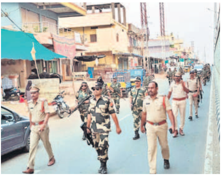
బీఎన్ఎఫ్ జవాబు, పోలీసు సిబ్బందితో షాగ్ మార్చ్