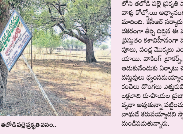
కొటాల : కళావిహారం తలోడి పల్లె ప్రకృతి వనం..

కొటాల, మే 5 : అధికారుల పట్టింపులేని తనంతో కొటాల మండలంలోని తలోడి పల్లె ప్రకృతి వనం ఆనవాళ్ళ కోల్పోయి అధ్యాసంగా మారింది. కేసీఆర్ సర్కారులో ఆఫ్ దకరంగా తీర్చిదిద్దిన ఈ వనం.. ప్రస్తుతం కళావిహారంగా మారింది. యూ, పండ్ల మొక్కలు ఎండిపోయాయి. వాకింగ్ ట్రాక్స్, పిల్లలు ఆడుకునేందుకు ఏర్పాటు చేసిన వస్తువులు ధ్వంసమయ్యాయి. కంచెలు దొంగలు ఎత్తుకుపోయారు. లక్షలాది రూపాయల ప్రజాధనం వ్యధా అవుతున్న పరిస్థితులను నాడుకే కరువయ్యాడని స్థానికులు మండిపడుతున్నారు.