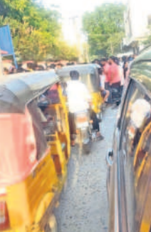
కార్వల్ స్కూల్ ముందు ల్యాండ్ కేల్ ఇరుక్కోవాయి వాహనాలు