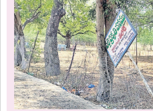
కెటాల : కళావిహారం తలోడి పల్లె ప్రకృతి వనం..

కెటాల, మే 5 : అధికారుల పట్టింపులేని తనంతో కెటాల మండలంలోని తలోడి పల్లె ప్రకృతి వనం ఆనవాళ్ళ కోల్పోయింది అధ్యాపకంగా మారంది. కేసీఆర్ సర్కారులో ఆఫ్ దకరంగా తీర్చిదిద్దిన ఈ వనం.. ప్రస్తుతం కళావిహారంగా మారింది. యూ, పండ్ల మొక్కలు ఎండిపోయాయి. వాకింగ్ ట్రాక్స్, పిల్లలు ఆడుకునేందుకు ఏర్పాటు చేసిన వస్తువులు ధ్వంసమయ్యాయి. కంచెలు దొంగలు ఎత్తుకుపోయారు. లక్షలాది రూపాయల ప్రజాధనం వ్యధా అవుతున్న పరిస్థితులను నాడుడే కరువయ్యాడని స్థానికులు మండిపడుతున్నారు.