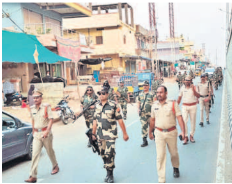
బీఎన్ఎఫ్ జవాబు, పోలీసు సిబ్బందితో షాగ్ మార్చ్