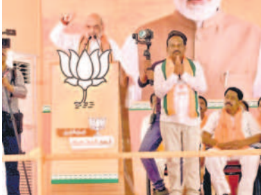
కాగజ్ నగర్లో మాట్లాడుతున్న అమిత్ షా

ఆసిఫాబాద్, మే 5 : కుటుంబం ఆసిఫాబాద్ జిల్లా కాగజ్ నగర్ పట్టణంలో ఆదివారం నిర్వహించిన వికాస సంకల్ప యాత్రలో కేంద్ర హోంశాఖ మంత్రి అమిత్ షా పాల్గొన్నారు. ముందుగా గిరిజనుల ఆరాధ్య దైవమైన నాగోబా, సరస్వతీ దేవి, సేవాలాల్ మహారాజ్ తో పాటు స్వాతంత్ర్య సమర యోధులు కుటుంబం, కొండా లక్ష్మణ్ బాబూజీకి వందనలు తెలిపారు. ఆనంతరం ఆయన మాట్లాడుతూ కాంగ్రెస్ పార్టీ అధికారంలోకి వస్తే అన్ని స్కామ్లలో ఉంటాయన్నారు. కాంగ్రెస్.. ఓటమి ఒక్కటేనని, అందుకే రామమందిర ప్రారంభోత్సవానికి రావాలి గాంటి హోజూర్ కాలేజీలో రద్దుతో ముస్లిం సోదరీమణులు సంక్షోభంగా ఉన్నారన్నారు. ముస్లిం రిజర్వేషన్ల రద్దు చేసే ఎస్సీ, ఎస్టీ, బీసీలకు ఇస్తామన్నారు.