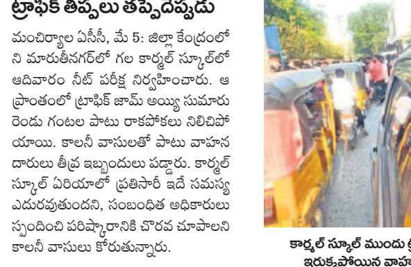
కార్వల్ సూల్ ముందు లాభికోల్ ఇరుక్కోయిన వాహనాలు