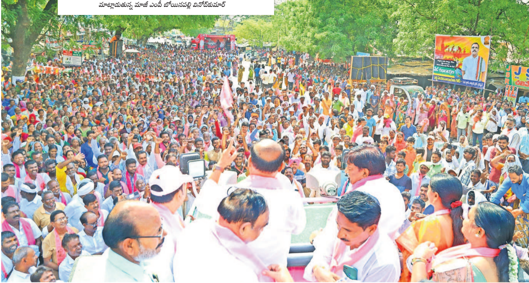
ముల్కనూరులో బీఆర్ఎస్ రోడ్ షోకు భారీగా తరలివచ్చిన ప్రజలు