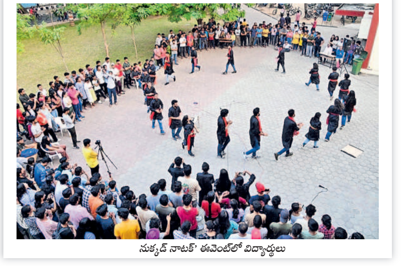
సుకృష్ నాటక్ ఈవెంట్లో విద్యార్థులు