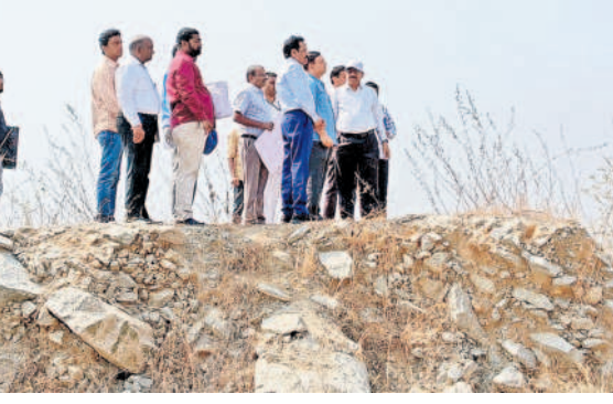
క్షేత్రగిరి గుట్టపై మిషన్ భగీరథ ట్యాంకింగ్ పాయింట్ ను పరిశీలిస్తున్న పంచాయతీరాజ్ ప్రిన్సిపల్ సెక్రటరీ సందీప్ కుమార్ సుల్తానియా