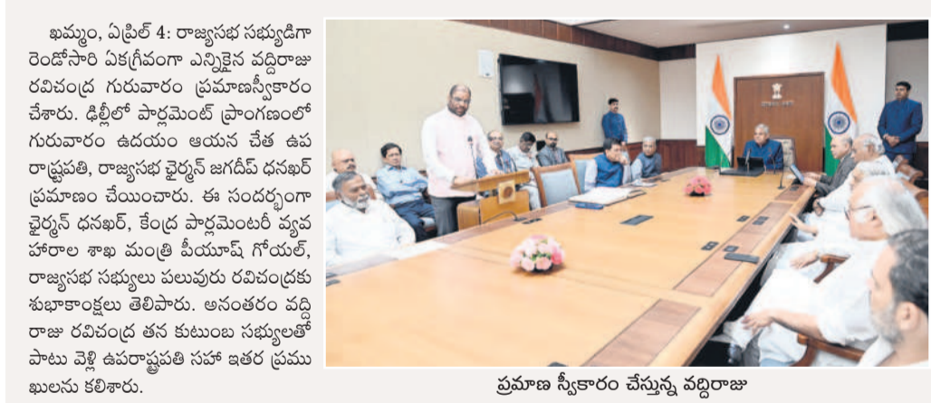
ప్రమాణ స్వీకారం చేస్తున్న వద్దిరాజు

ఖమ్మం, ఏప్రిల్ 4: రాజ్యసభ సభ్యుడిగా రెండోసారి ఏకగ్రీవంగా ఎన్నికైన వద్దిరాజు రవిచంద్ర గురువారం ప్రమాణస్వీకారం చేశారు. ఢిల్లీలో పార్లమెంట్ ప్రాంగణంలో గురువారం ఉదయం ఆయన కేత ఉప రాష్ట్రపతి, రాజ్యసభ చైర్మన్ జగదీష్ దనభర్ ప్రమాణం చేయించారు. ఈ సందర్భంగా చైర్మన్ దనభర్, కేంద్ర పార్లమెంటు వ్యవహారాల శాఖ మంత్రి వీయోపి గోయల్, రాజ్యసభ సభ్యులు పలువురు రవిచంద్రకు శుభాకాంక్షలు తెలిపారు. అనంతరం వద్దిరాజు రవిచంద్ర తన కుటుంబ సభ్యులతో పాటు వెళ్లి ఉపరాష్ట్రపతి సహా ఇతర ప్రముఖులను కలిశారు.