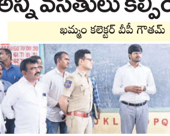
కల్లూరు హనుమాంతా ప్రాథమికోన్నత పాఠశాలలో ఏర్పాటు చేసిన పరిశీలిస్తున్న కలెక్టర్, సీపీ