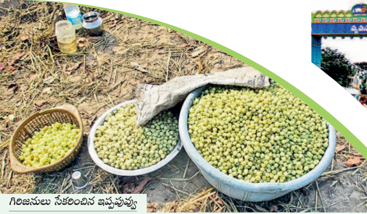
గిరిజనులు సేకరించిన ఇప్పపువ్వు