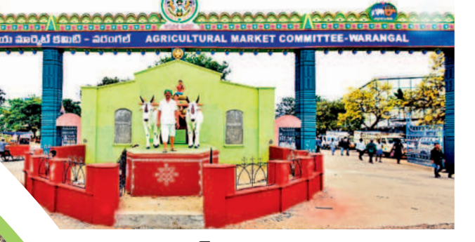
వరంగల్లోని ఆర్థిక మార్కెట్ కమిటీ కార్యదర్శి కార్యాలయం