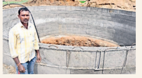
మాడెకరాల కోసం బాయి తవ్విన

150 కిలోమీటర్ల వరకు నీటి నిల్వల్లో అన్ని ప్రాంతాల్లో భూగర్భ జలాలు పెరిగాయి. ప్రతి ఊరిలోనూ సరిపడా భూగర్భ జలాలు ఉండడం, ఎప్పుడీకప్పుడు ప్రాజెక్టుల నుంచి చెరువులకు, అక్కడి నుంచి పంటలకు నీళ్లు వచ్చేవి. వానకాలం పంటలకు నీటి వసతిలో ఎక్కడా ఇబ్బంది లేకుండా సాగింది. కాంగ్రెస్ ప్రభుత్వ అధికారంలోకి వచ్చిన తర్వాత సాగునీటి నిర్వహణపై నిర్లక్ష్యంగా వ్యవహరిస్తున్నది. దేవాదుల ప్రాజెక్టు నుంచి పంటింగ్ జరుగుతున్నా నీటి సరఫరా నిర్వహణలో విఫలమైంది. ఎస్సారెస్సె ఆయ కట్టు విషయంలోనూ ఇదే జరిగింది. దేవాదుల ప్రాజెక్టు పరిధిలో ఇదేండ్లగా రెండు పంటలకు నిర్వహణగా నీళ్లు వచ్చే గ్రామాలకు ఇప్పుడు రావడం లేదు. సాగునీటి సరఫరా నిర్వహణలో ప్రభుత్వ లోపం కారణంగా అంతటా భూగర్భ జలాలు వేగంగా తగ్గాయి. నెల రోజుల్లోనే సగటున మీటరు లోపలికి వెళ్ళాయి. దీంతో ఇప్పటికే ఉన్న బోరు, బావుల్లో నీళ్లు అడుగంటుతున్నాయి. రాష్ట్ర ప్రభుత్వం ఎప్పుడీలాగే సాగు నీరు సరఫరా చేస్తుందని రైతులు ఈ యాసంగిలోనూ పంటలు వెళారు. నీళ్లు లేక పంటలు ఎండి పోయే పరిస్థితి వచ్చింది. సాగునీటి సరఫరా విషయంలో రాష్ట్ర ప్రభుత్వంపై రైతులు క్రమంగా నమ్మకం కోల్పోతున్నారు. ఒక్కో కర్షుకారు సొంతంగా నీటి వనరులను ఏర్పాటు చేసుకుంటున్నారు. ఇన్నోవేషన్ పంటలతో వచ్చిన షైవలను ఇప్పుడు కొత్త బావుల కోసం, పాత బావుల పూడికతీతం కోసం ఖర్చు చేస్తున్నారు.