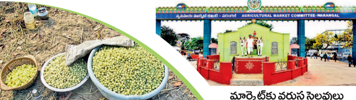
గిరిజనులు సేకరించిన ఇప్పపువ్వు