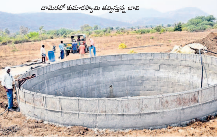
దామెరలో కుమారస్వామి తవ్వెత్తున్న బావి

కాంగ్రెస్ ప్రభుత్వ పరిపాలన తీరుతో అన్నదాతలకు అరిగోస పడుతున్నారని... రాష్ట్రం ఏర్పడినప్పటి నుంచి సాగునీటి దీమంతో పంటలు సాగు చేసిన రైతులకు ఇప్పుడు పంట చేతికి వస్తున్నాడంటే అందోజం పెరుగుతున్నది.