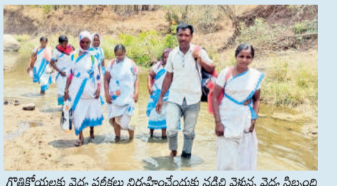
గొత్తకోయలకు వైద్య పరీక్షలు నిర్వహించేందుకు నడిచి వెళ్తున్న వైద్య సిబ్బంది

ఖిలావరంగల్, ఏప్రిల్ 4: బిట్ డ్రైట్ పార్కు భూ నిర్మాణములకు పరిహారం చెల్లించడంలో జాప్యం చేస్తూ కోర్టు ఉత్తర్వులను అమలు చేయలేదని వరంగల్ ఆర్టిస్ట్ కార్యాలయంలోని ఆస్తులను జప్తు చేశారు.