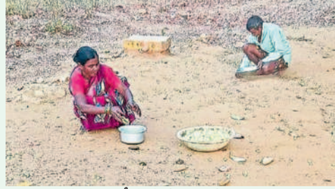
ఇప్ప పూల సేకరిస్తున్న గిరిజనులు

అటువంటి కష్టాలకు సరైన గిట్టుబాటు ధర రాకపోవడంతో ప్రస్తుతం వీటి సేకరణపై గిరిజనుల ఆసక్తి యేటా తగ్గుతూ వస్తున్నది. ప్రస్తుతం ఇప్పపువ్వును జనీస్ ద్వారా కిలో రూ.30కు కొనుగోలు చేస్తున్నారు.