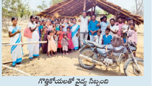
గొత్తకోయలకు వైద్య సిబ్బంది

గోవిందరావుపేట, ఏప్రిల్ 4: మండలంలోని కల్యాణ గ్రామ శివారులోని జారుడు బండ అటవీ సమీపంలో నివసిస్తున్న గొత్తకోయలకు వైద్యసేవల అందంచేందుకు వైద్య సిబ్బంది 14 కిలోమీటర్ల మర అడవుల్లో నడుస్తూ వాగును దాటి మండుబెండలో వెళ్లారు.