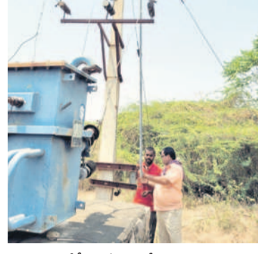
ఏపీకే సమీపంలో ట్రాన్స్మిషన్ జంపర్ కట్ చేస్తున్న విద్యుత్ సిబ్బంది

పెద్దఅభివృద్ధి ఏప్రిల్ 2 : ఏఎమ్సార్టీ ప్రాజెక్టు నుంచి విద్యుత్ మోటర్ల ద్వారా సాగు సేవించుకున్న రైతులకు అధికారులు మంగళవారం నుంచి విద్యుత్ సరఫరాను నిలిపివేస్తున్నారు. తాగునీటి అవసరాలకు ప్రధాన కార్యకర్తల నీటిని విడుదల చేస్తున్న సేవ ధ్యంతుల వ్యవసాయ మోటర్లు రన్ చేస్తే వివిధ వరకు నీరు చేరదని ఉన్నతాధికారుల అధికారి మేరకు ట్రాన్స్మిషన్లకు జంపర్లు కట్ చేస్తున్నారు. మధ్యాహ్నంలోగా జంపర్లు కట్ చేసి ఒక్క వ్యవసాయ మోటరు కూడా నడవకూడదని దేవరకొండ ఏపీసీ సీనియర్ అధికారి జాగీ చేశారు. దాంతో విద్యుత్ సిబ్బంది రంగంలోకి దిగారు. అక్కడపల్లి, రంగారెడ్డి గూడెం, దుగ్యాల, పీపిపల్లి శివారులో ట్రాన్స్మిషన్లకు విద్యుత్ సరఫరా పూర్తిగా నిలిపివేశారు. మండలంలోని పుట్టంగండ్ల నుంచి ఏపీకే వరకు ఉన్న అనుసంధాన కాల్య, డిస్ట్రిబ్యూటర్ -7 ఆయకట్టుకు మొదటి నుంచి తాగునీటి కోసం నీటిని విడుదల చేస్తుండడంతో రైతులు ఆధారపడి వరినాట్లు చేశారు. వివరికి పంట పొట్లకు వచ్చే దశలో విద్యుత్ అధికారులు వ్యవసాయ మోటర్లకు నీటి సరఫరా నిలిపివేయడంతో రైతులు ఆందోళన చెందుతున్నారు. మం గళవారం డిస్ట్రిబ్యూటర్ -7 పరిధిలోని రాంపల్లెం, పీపిపల్లి, దుగ్యాల శివారులో ట్రాన్స్మిషన్లకు విద్యుత్ ఏ.ఈ. కావ్య అభ్యర్థులతో ట్రాన్స్మిషన్లకు జంపర్లు తొలగించారు. మరో పది హెన్ రోజుల్లో పంట చేతికి వచ్చే సమయంలో