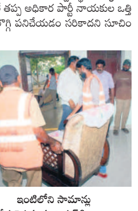
ఇంటిలోని సామాన్లు తీసుకున్న మున్సిపల్ సిబ్బంది

నందికొండలోని బీఆర్ఎస్ నాయకులపై కాంగ్రెస్ ఎమ్మెల్యే జయవీరరెడ్డి, వారి అనుచరులు కక్ష సాధింపు చర్యలకు పాల్పడుతున్నారని బీఆర్ఎస్ శ్రేణులు అంటున్నాయి. ఇటీవల నందికొండ మున్సిపాలిటీ చైర్మన్ బి.ఎస్.ఎస్. నివాస గృహాన్ని ఖాళీ చేయించగా, నాగార్జున సాగర్ నియోజకవర్గ బీఆర్ఎస్ యువజన నాయకుడు రామారావు సోదరుడి గృహ ప్రవేశానికి సిద్ధంగా ఉన్న నివాస గృహాన్ని జేసీబీలతో నేల మట్టం చేశారని తెలిపారు. కాజాగా మాజీ ఎమ్మెల్యే నోముల భగత్ నివాసం గృహాన్ని ఎమ్మెల్యే క్యాంప్ ఆఫీస్ సాకుతో