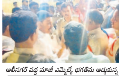
అలీనగర్ వద్ద మాజీ ఎమ్మెల్యే భగత్ నివాస అడ్డుకున్న పోలీసులు

దౌర్భాగ్యంగా, ఎటువంటి సమాచారం లేకుండా ఇంట్లో సామగ్రిని బయటకు తీసి ఇంటిని సీజ్ చేశారని ఆగ్రహం వ్యక్తం చేస్తున్నారు.