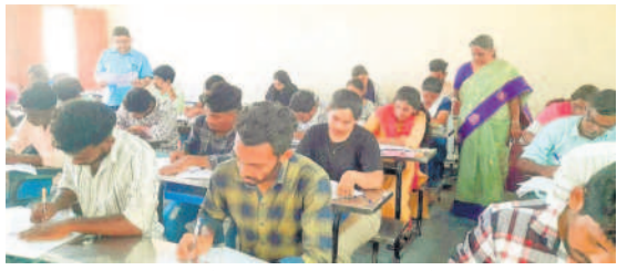
నల్లగొండలోని డాన్ బాస్కో కళాశాలలో పరీక్షలను పరిశీలిస్తున్న ఎంజీయూ రిజిస్టర్, అసిస్టెంట్ కంట్రోలర్